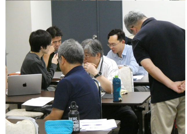
第3回セミナー伊豆合宿 （2025年6月）