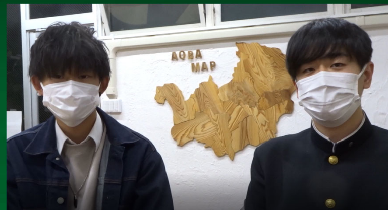
神奈川県立高校2年生