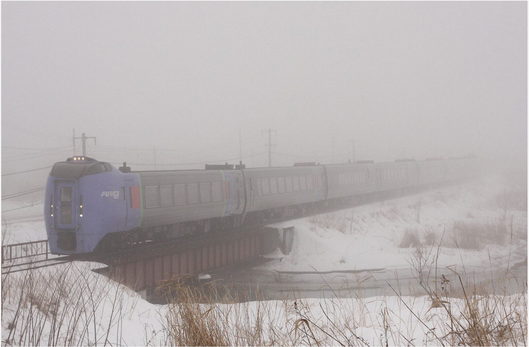
根室本線音別ー古瀬 キハ283系特急「スーパーおおぞら」 2012年2月