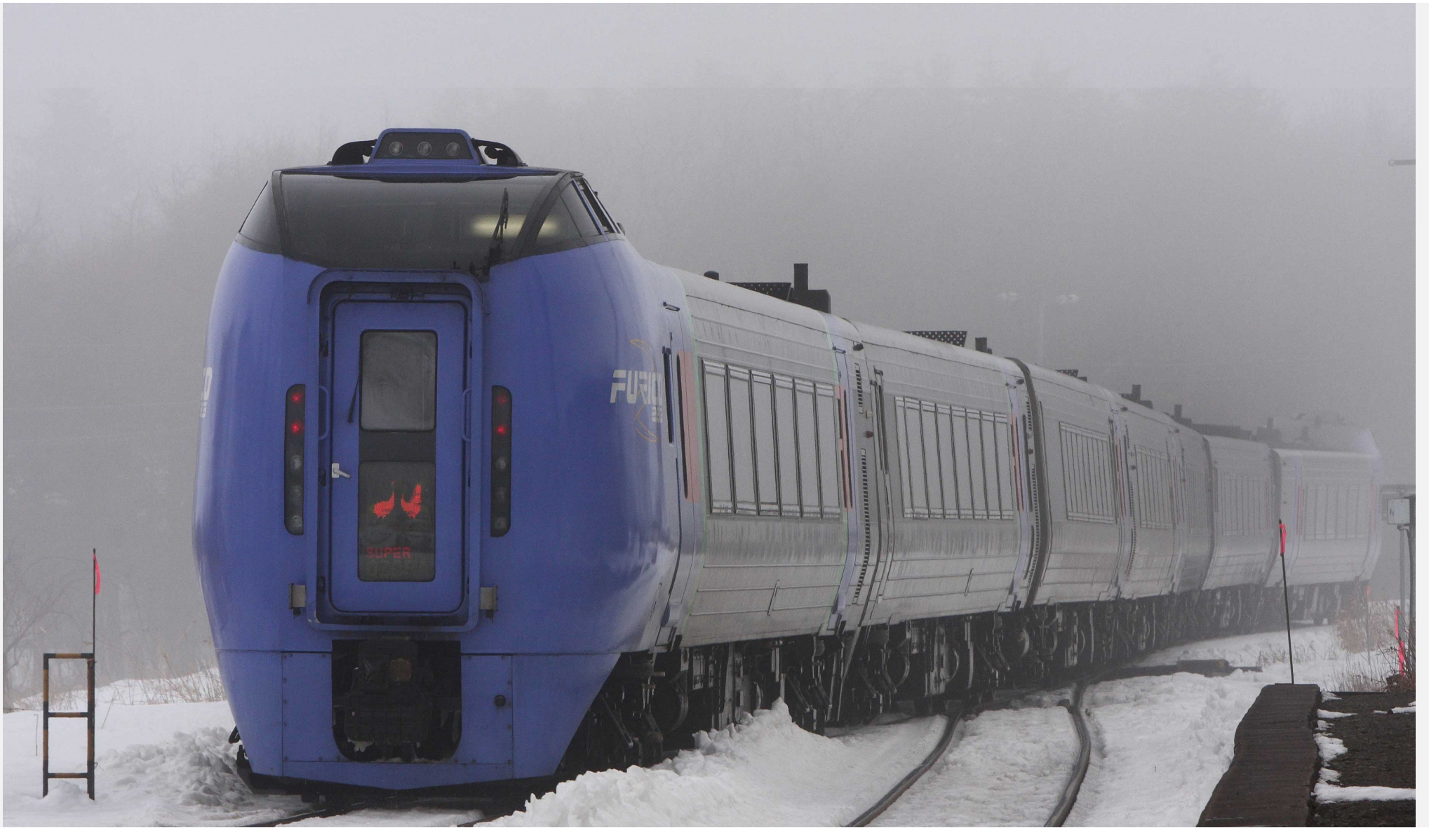
根室本線直別駅 キハ283系特急「スーパーおおぞら」 2012年2月