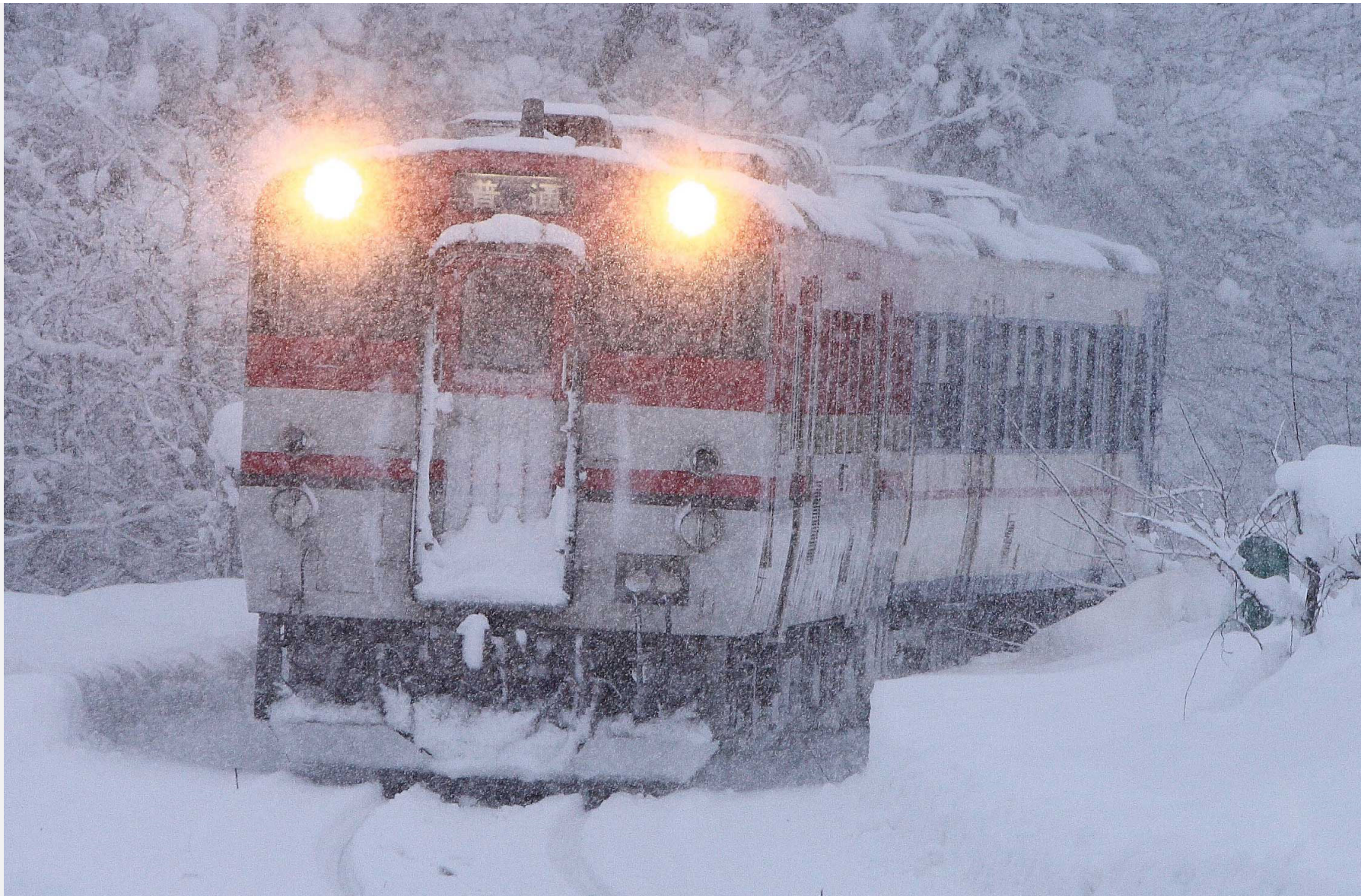
磐越西線上野尻－野沢 キハ40系普通列車 2017年1月