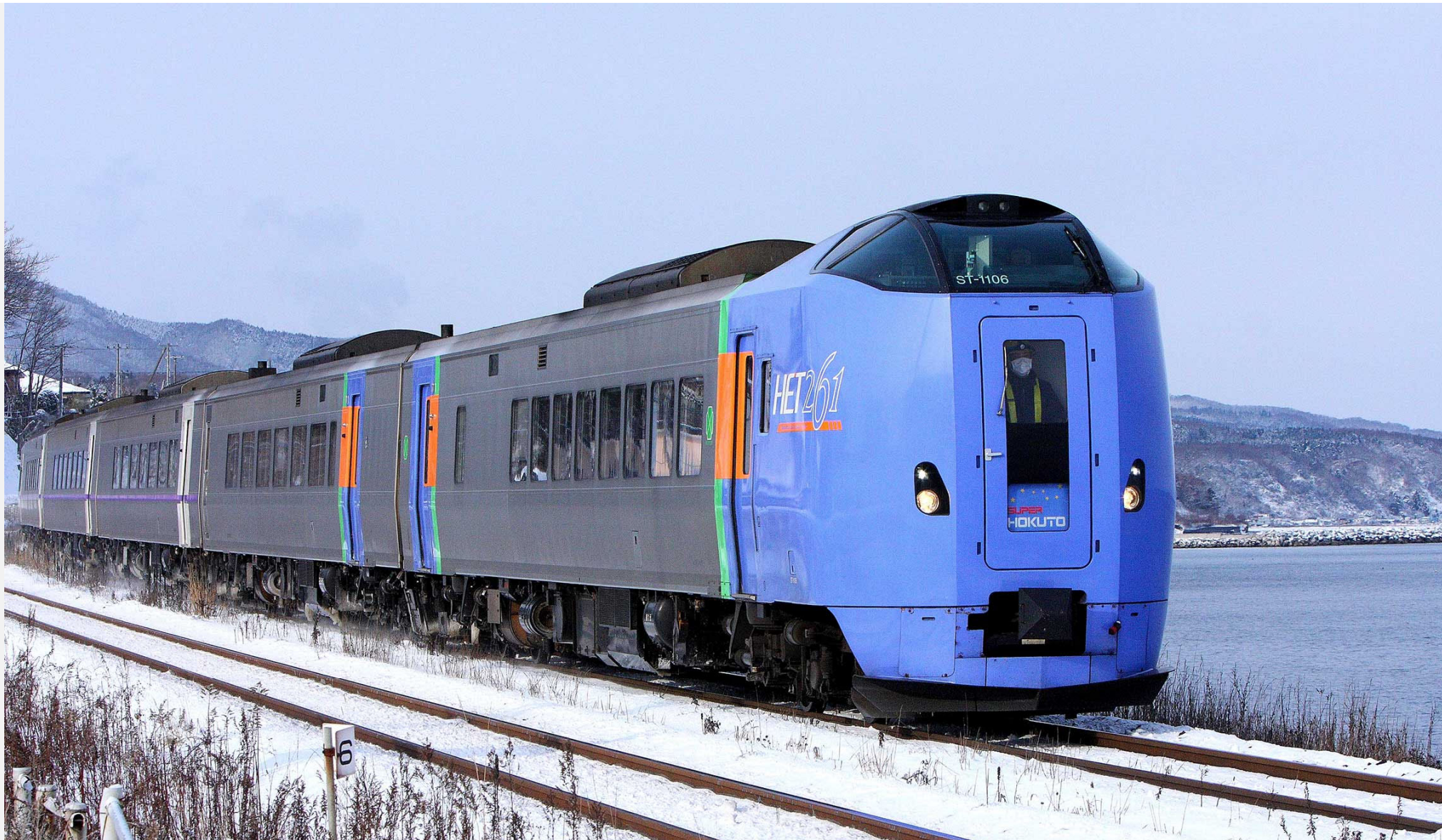
函館本線石谷一森 キハ261系特急「スーパー北斗」 2017年12月