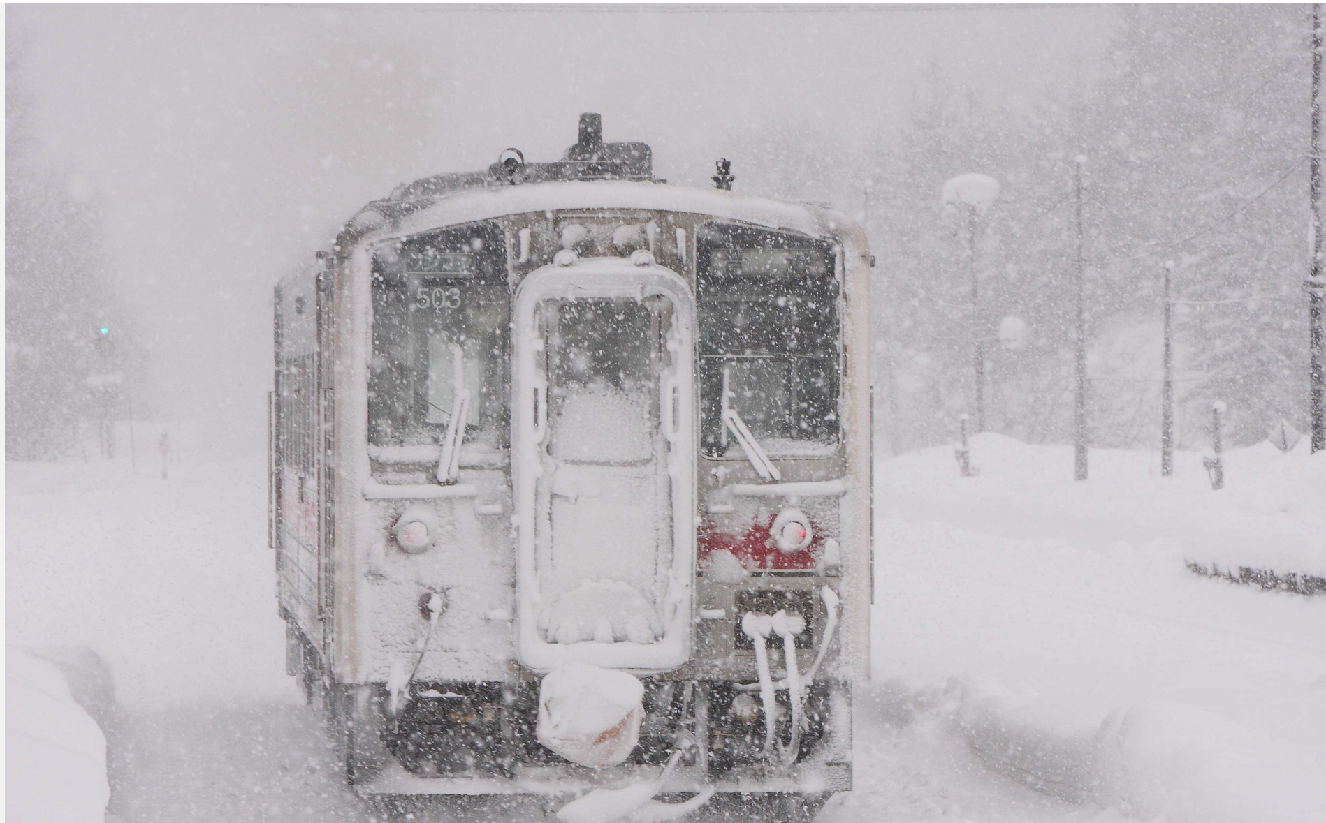
宗谷本線塩狩駅 キハ54形普通列車 2014年2月