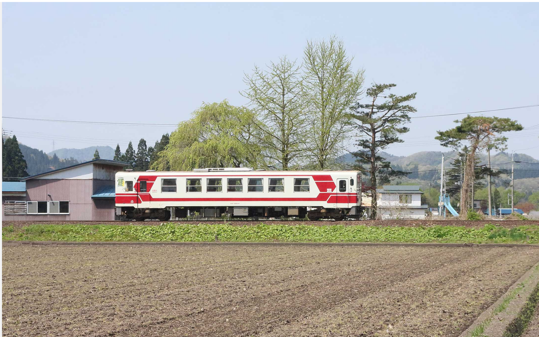
秋田内陸縦貫鉄道 角館一羽後太田 AN-8800形普通列車 2022年5月