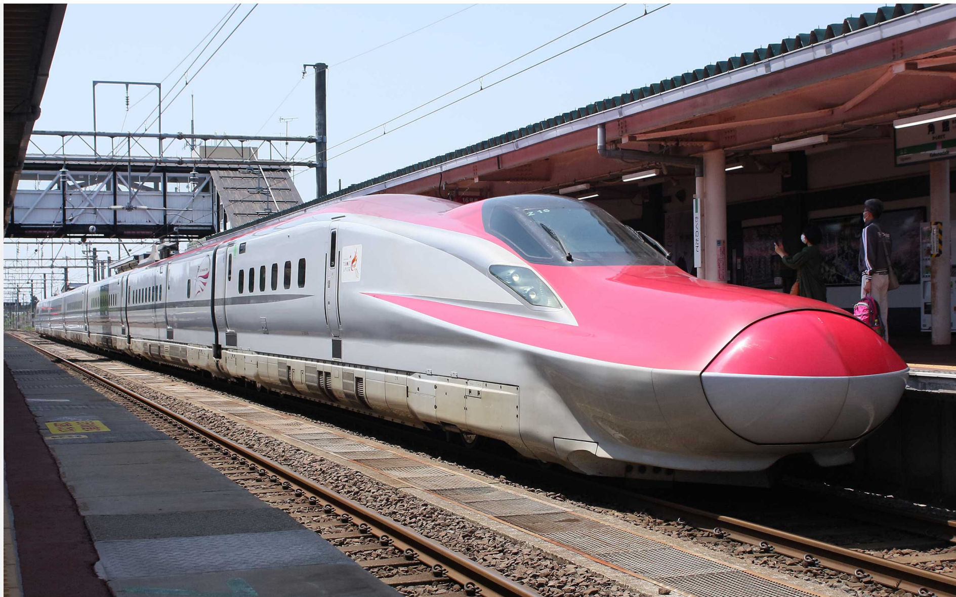
角館駅（秋田新幹線） E6系「こまち」 2022年5月