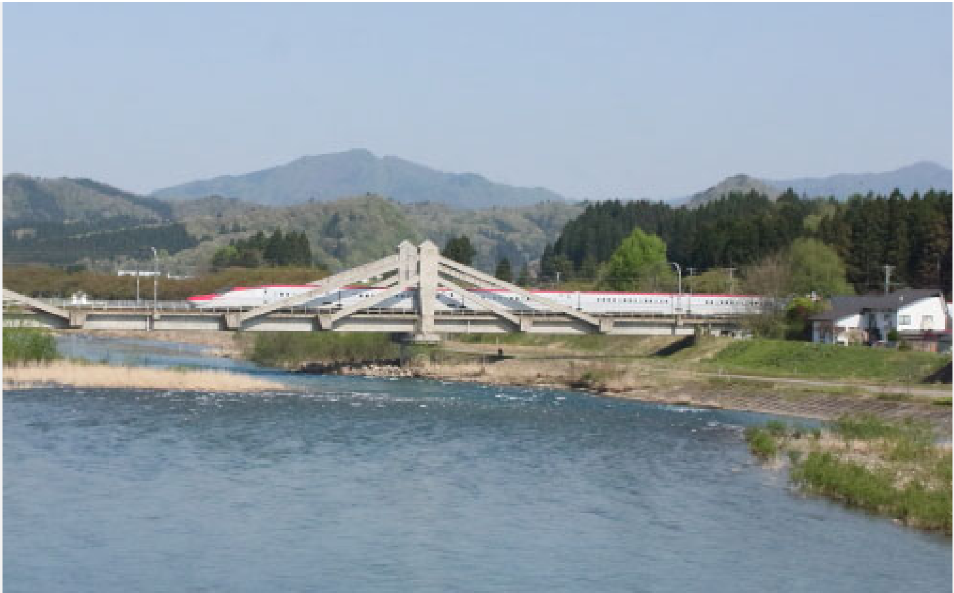
秋田新幹線鶯野一角館 E6系「こまち」 2022年年5月