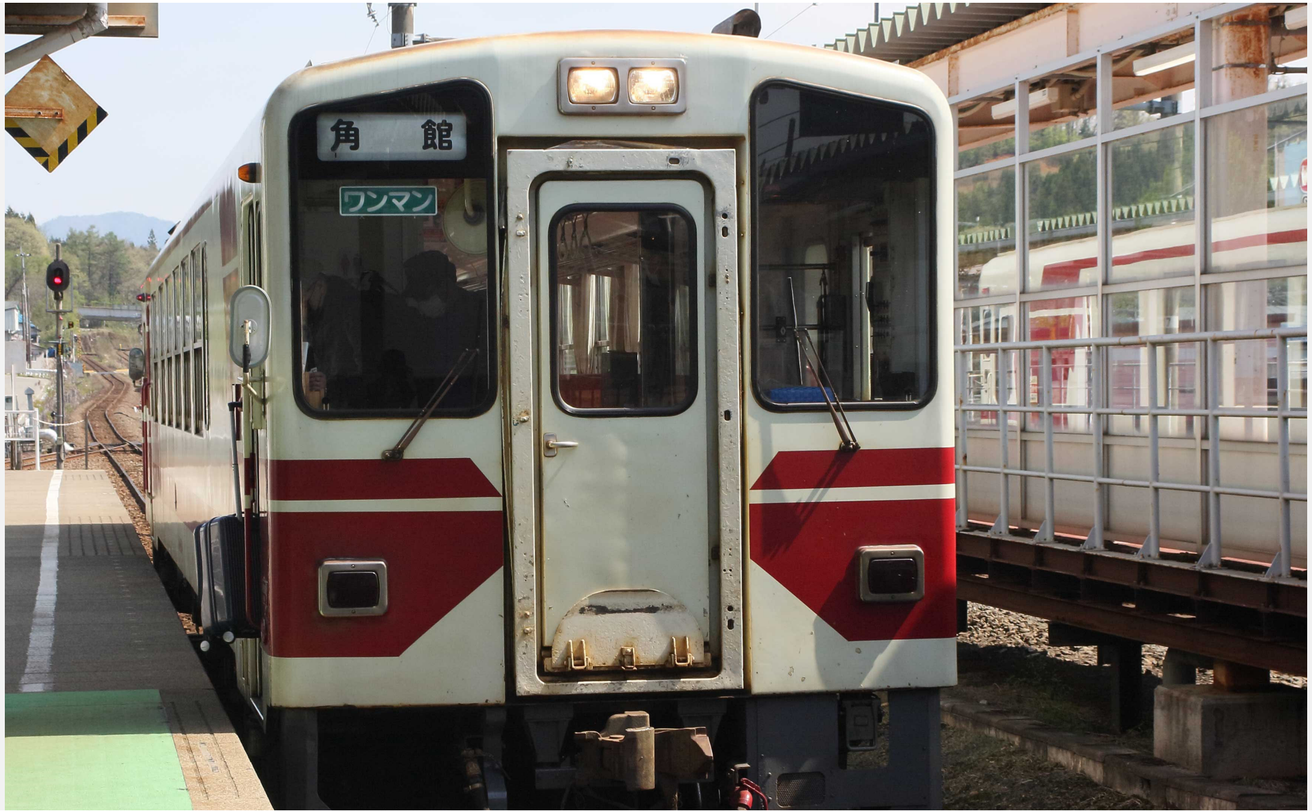
角館駅（秋田内陸縦貫鉄道） AN-8800形普通列車 2022年5月