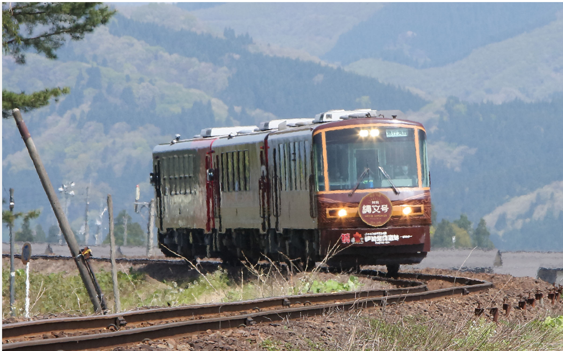
秋田内陸縦貫鉄道 西明寺ー羽後太田 AN-2000形急行「もりより」 2022年5月