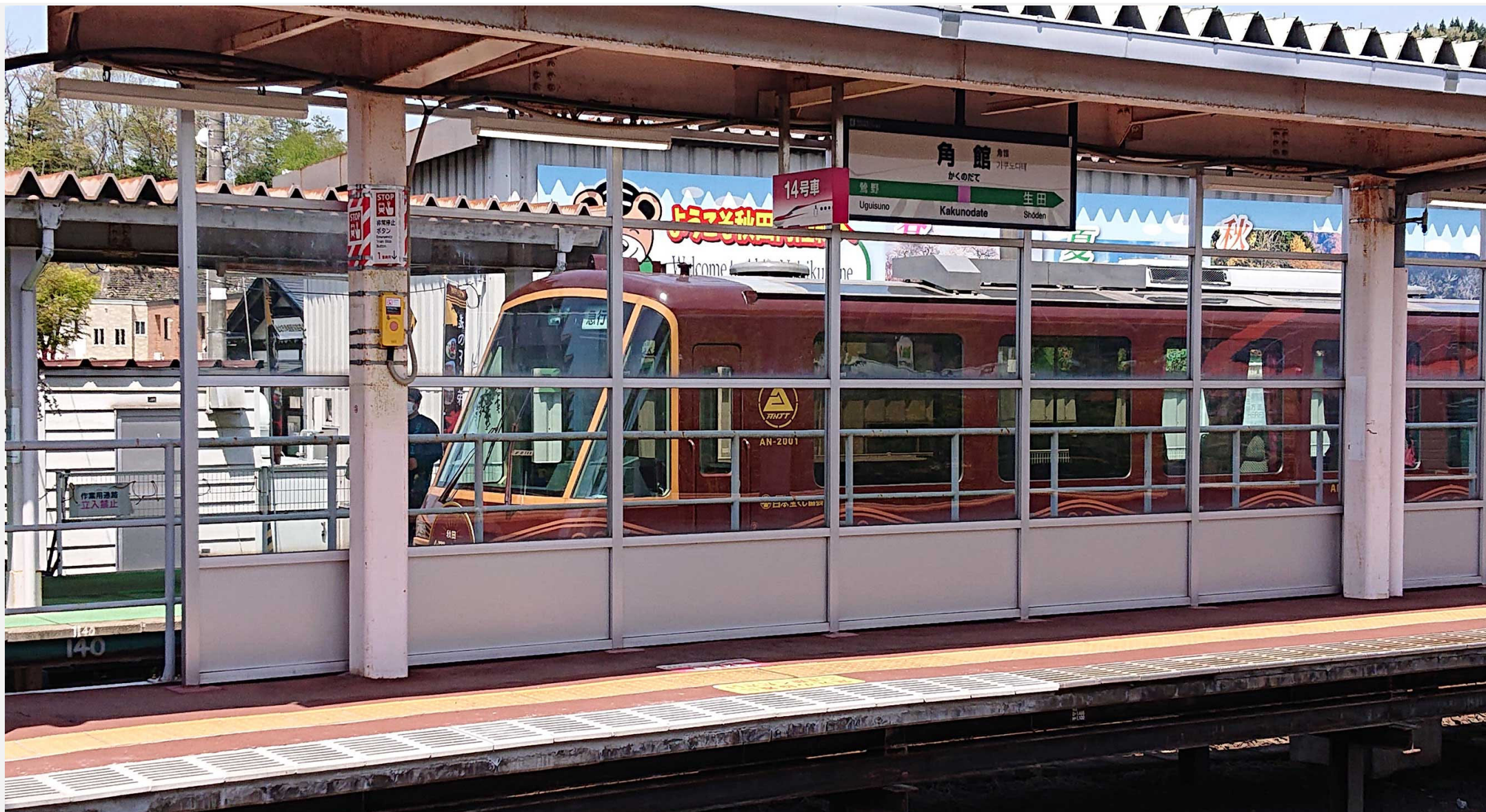
角館駅（秋田内陸縦貫鉄道）