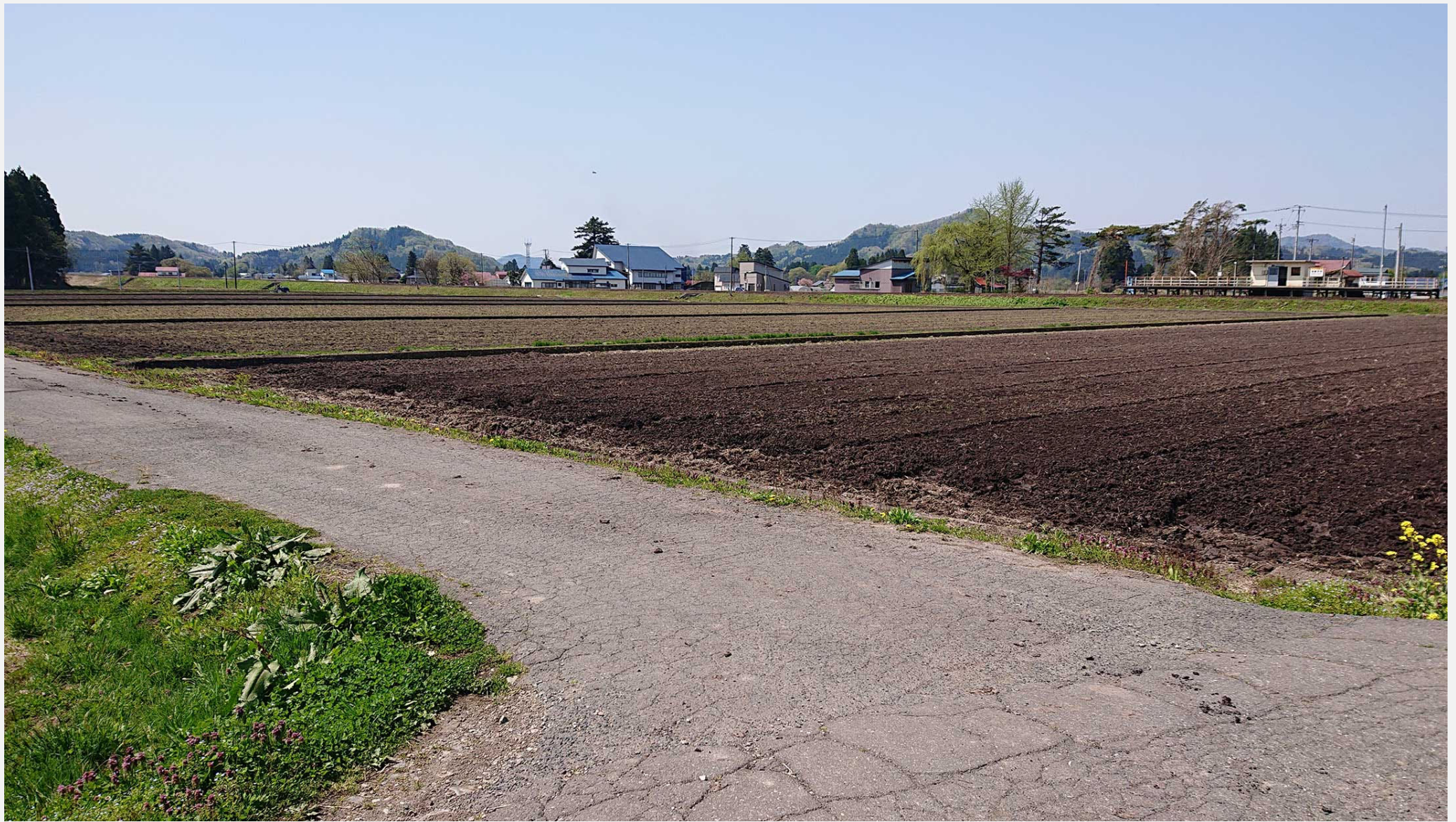
秋田内陸縦貫鉄道 羽後太田駅付近 2022年5月