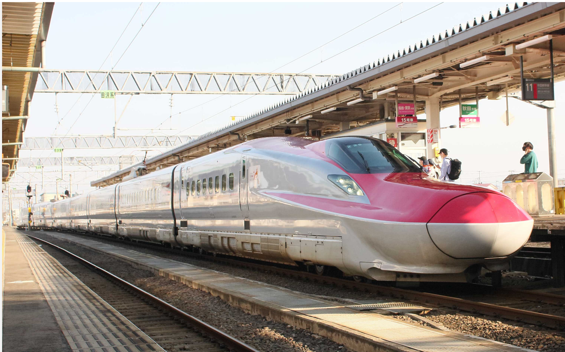
大曲駅 秋田新幹線E6系「こまち」 2022年5月