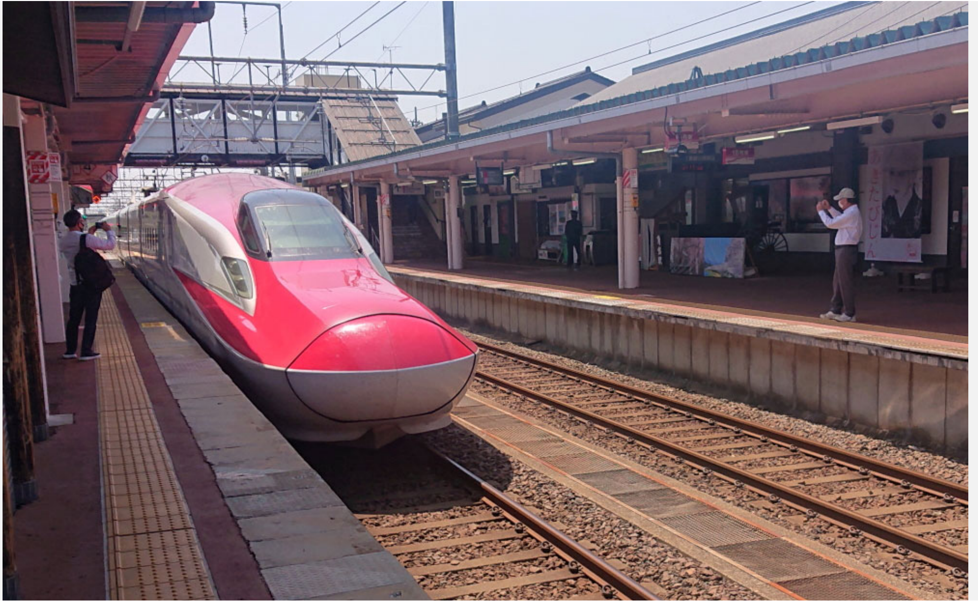
角館駅（秋田新幹線） E6系「こまち」 2022年5月