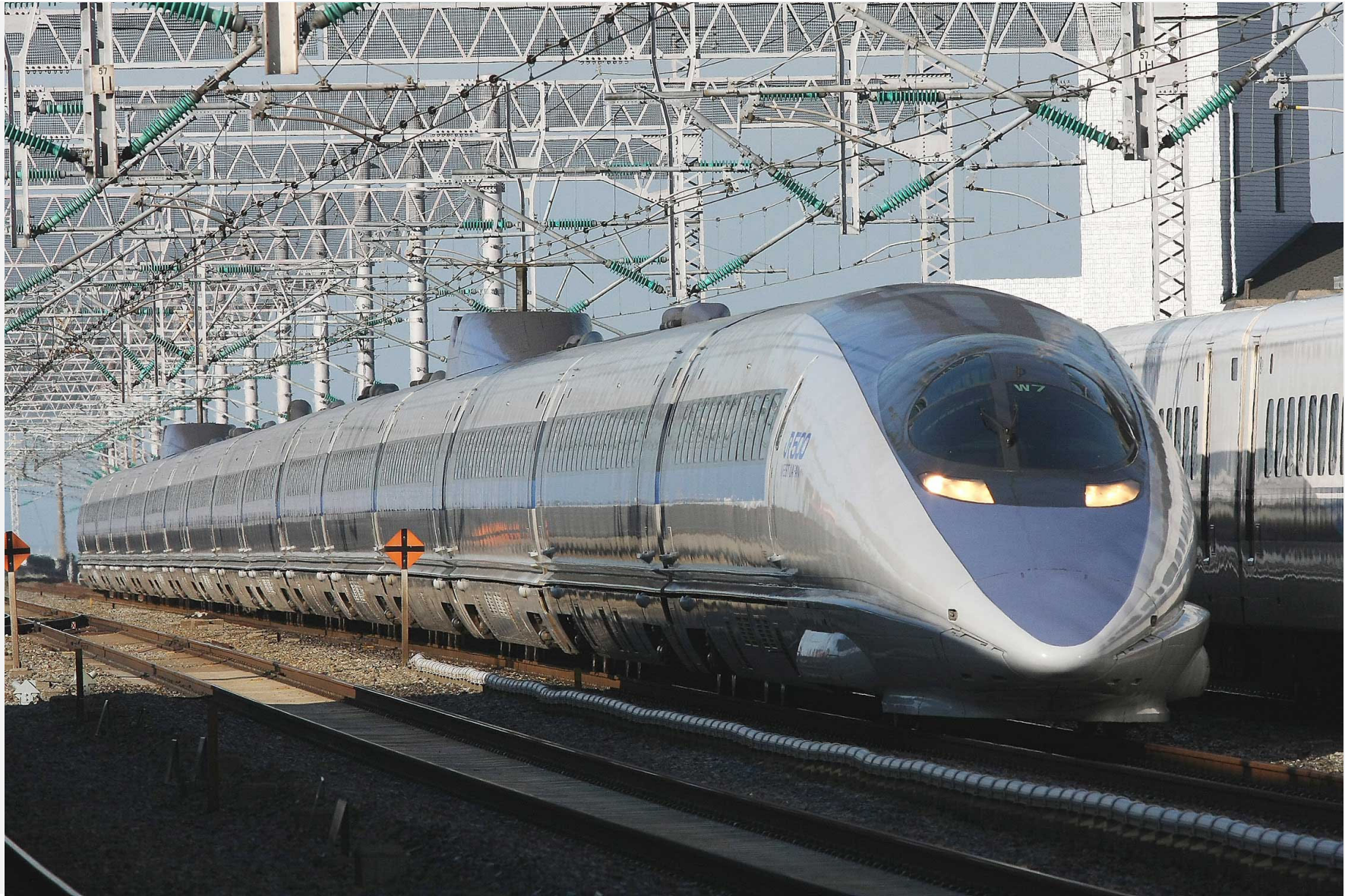
山陽新幹線新神戸駅通過 500系新幹線「のぞみ」 2008年11月