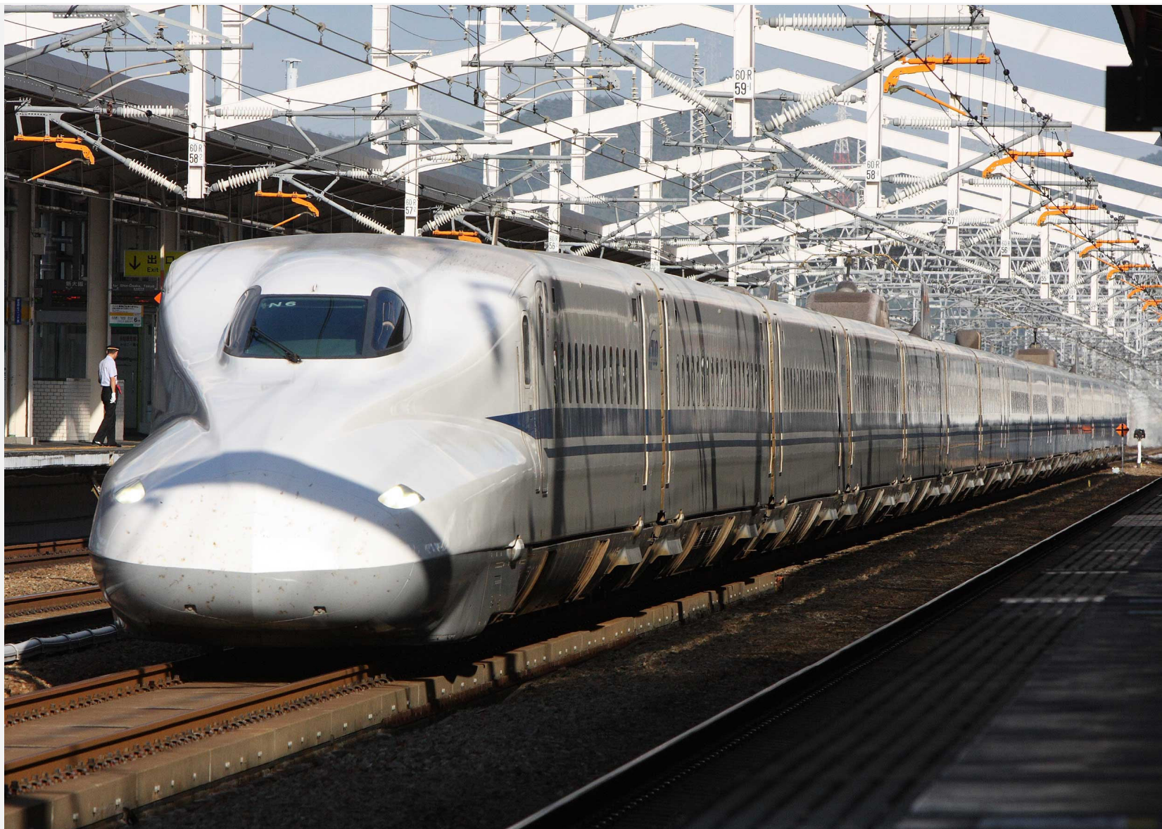
山陽新幹線相生駅通過 N700系新幹線「のぞみ」 2011年9月