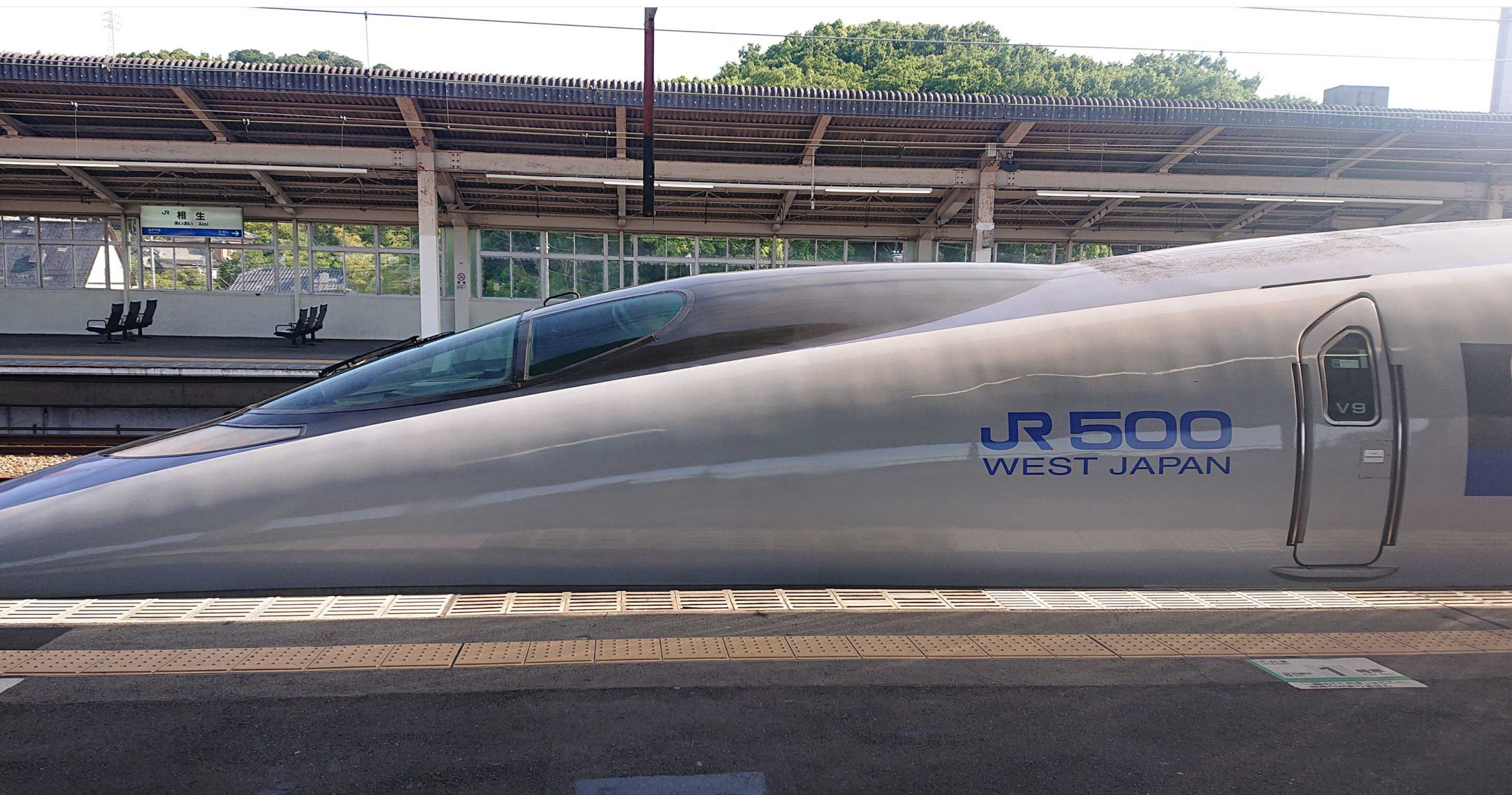
山陽新幹線相生駅 500系新幹線「こだま」 2022年6月