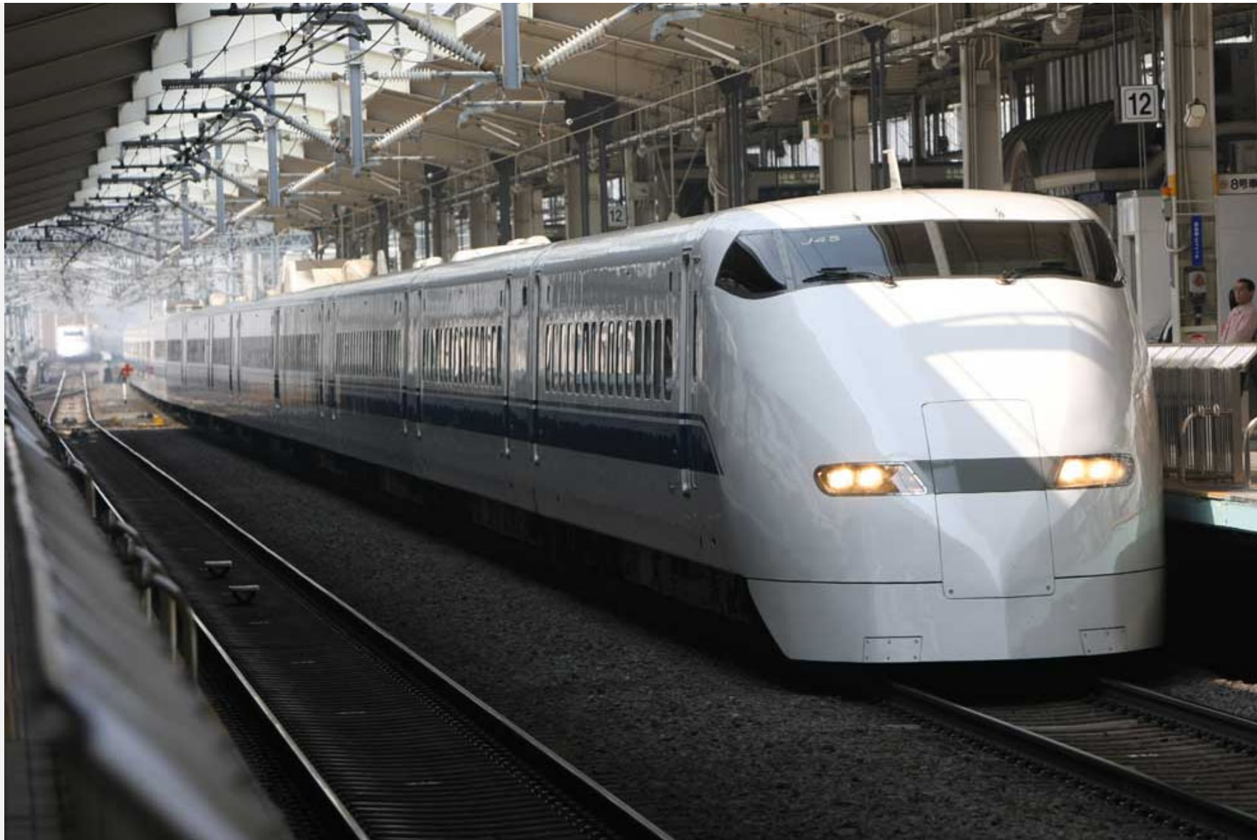
東海道新幹線京都駅 300系新幹線「のぞみ」 2008年3月