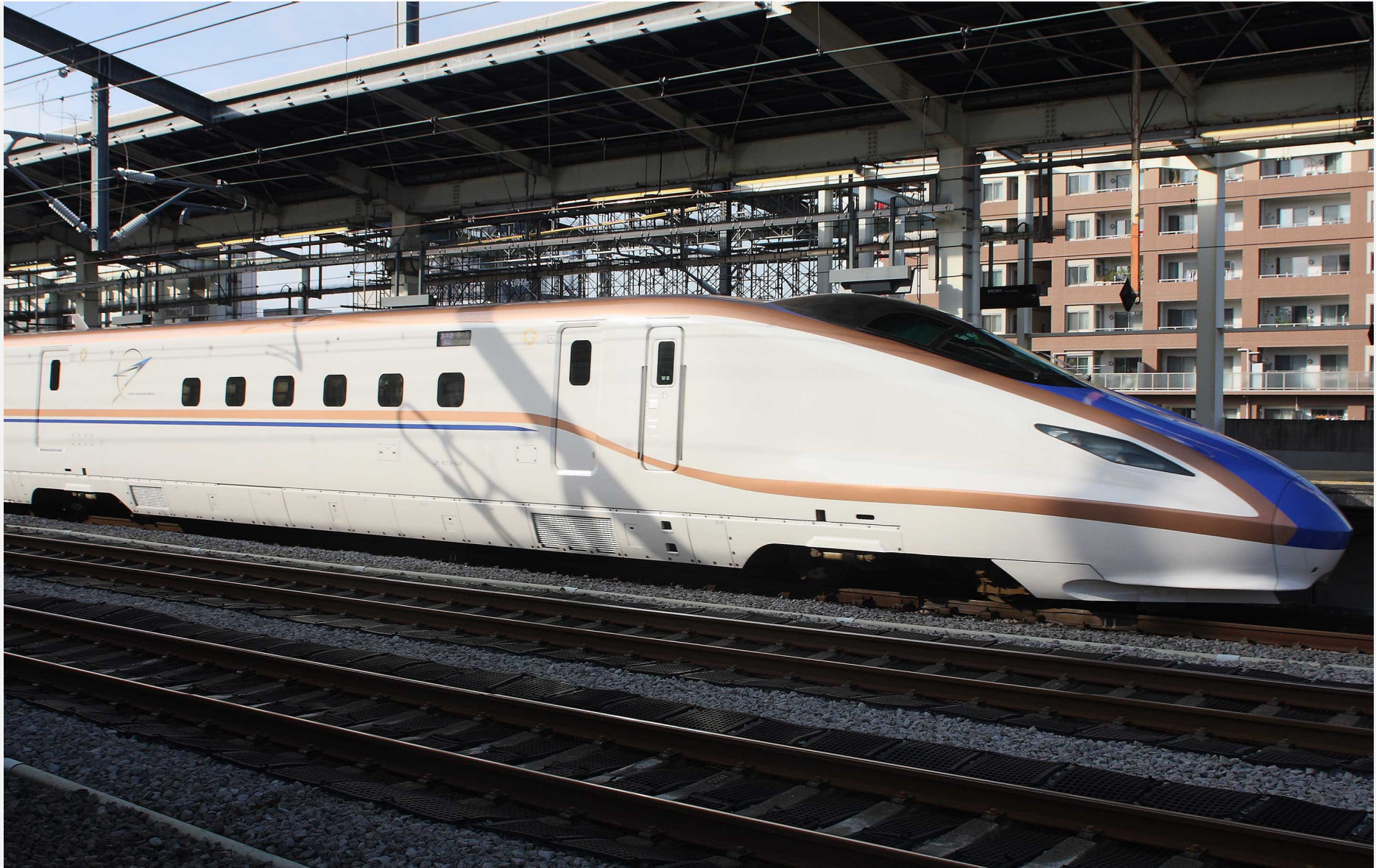
高崎駅 E7系新幹線「あさま」 2016年10月