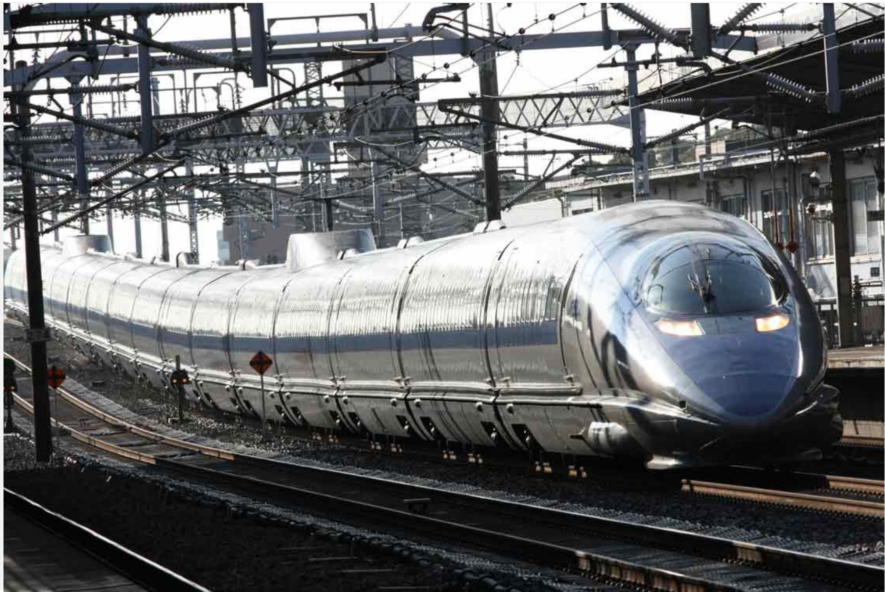
東海道新幹線豊橋駅通過 500系新幹線「のぞみ」 2009年2月