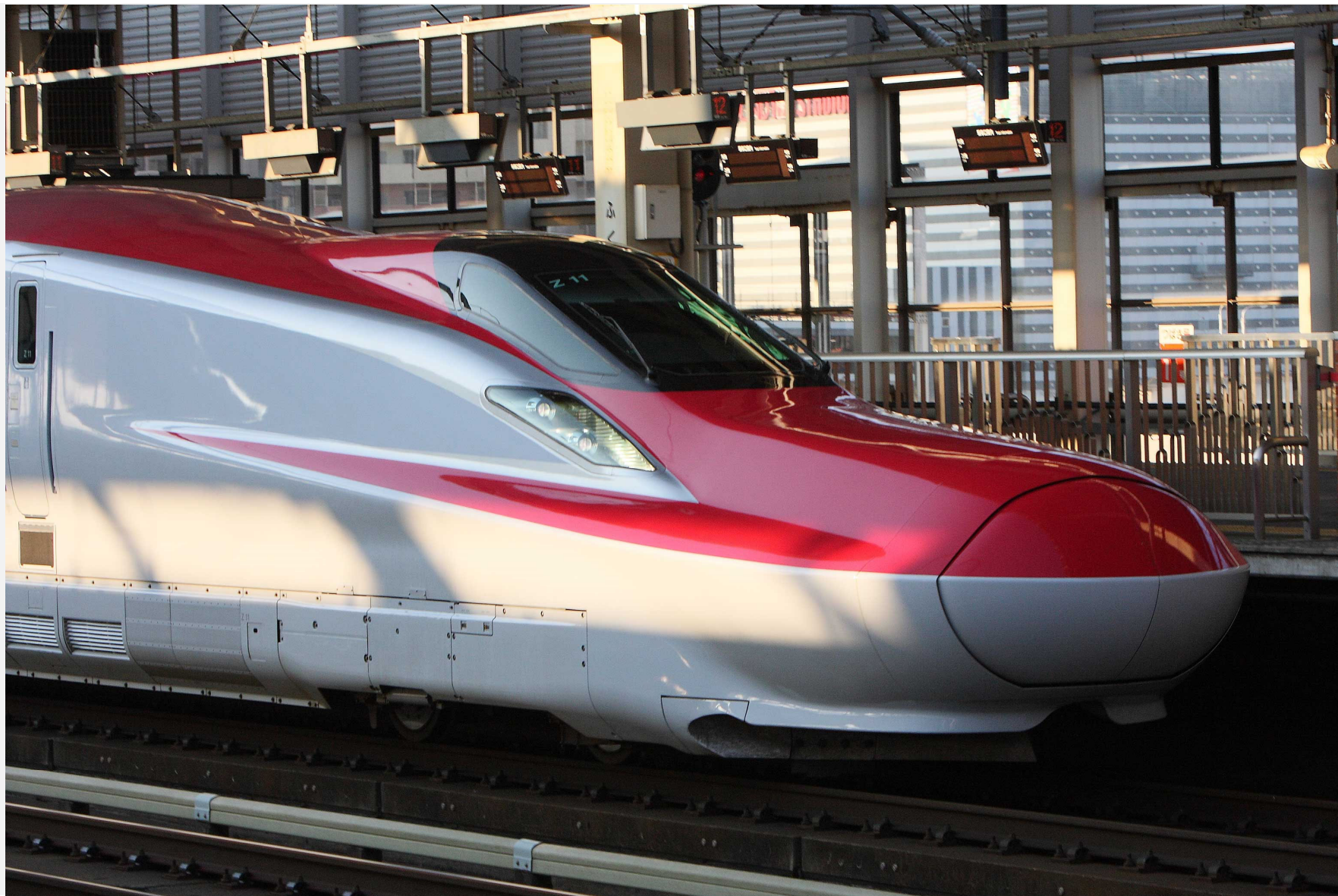
東北新幹線福島駅 E6系新幹線「やまびこ」 2013年11月