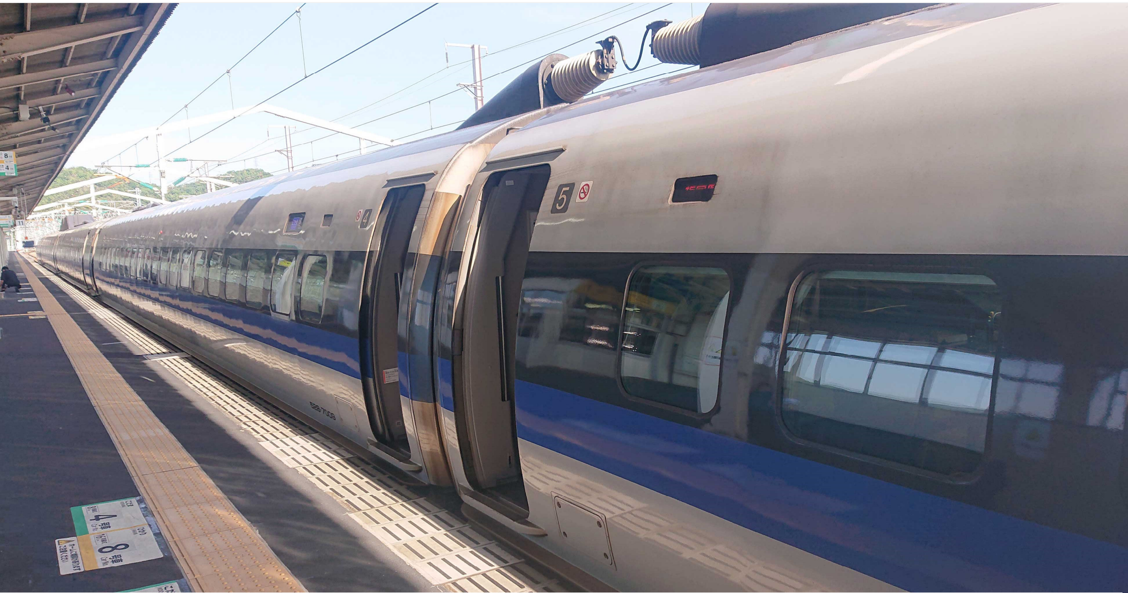
山陽新幹線相生駅 500系新幹線「こだま」 2022年6月