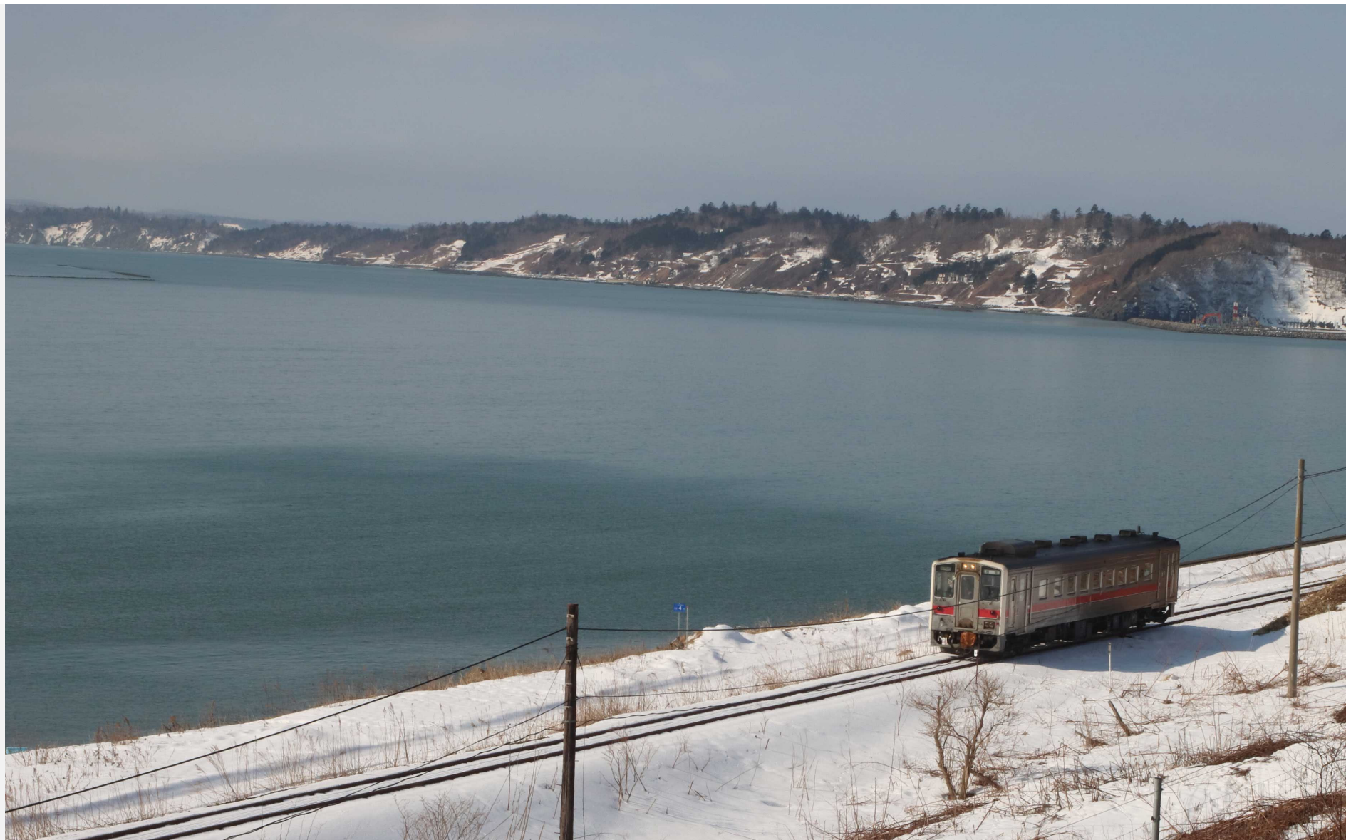
根室本線（花咲線）門静一厚岸 キハ54形普通列車 2023年3月