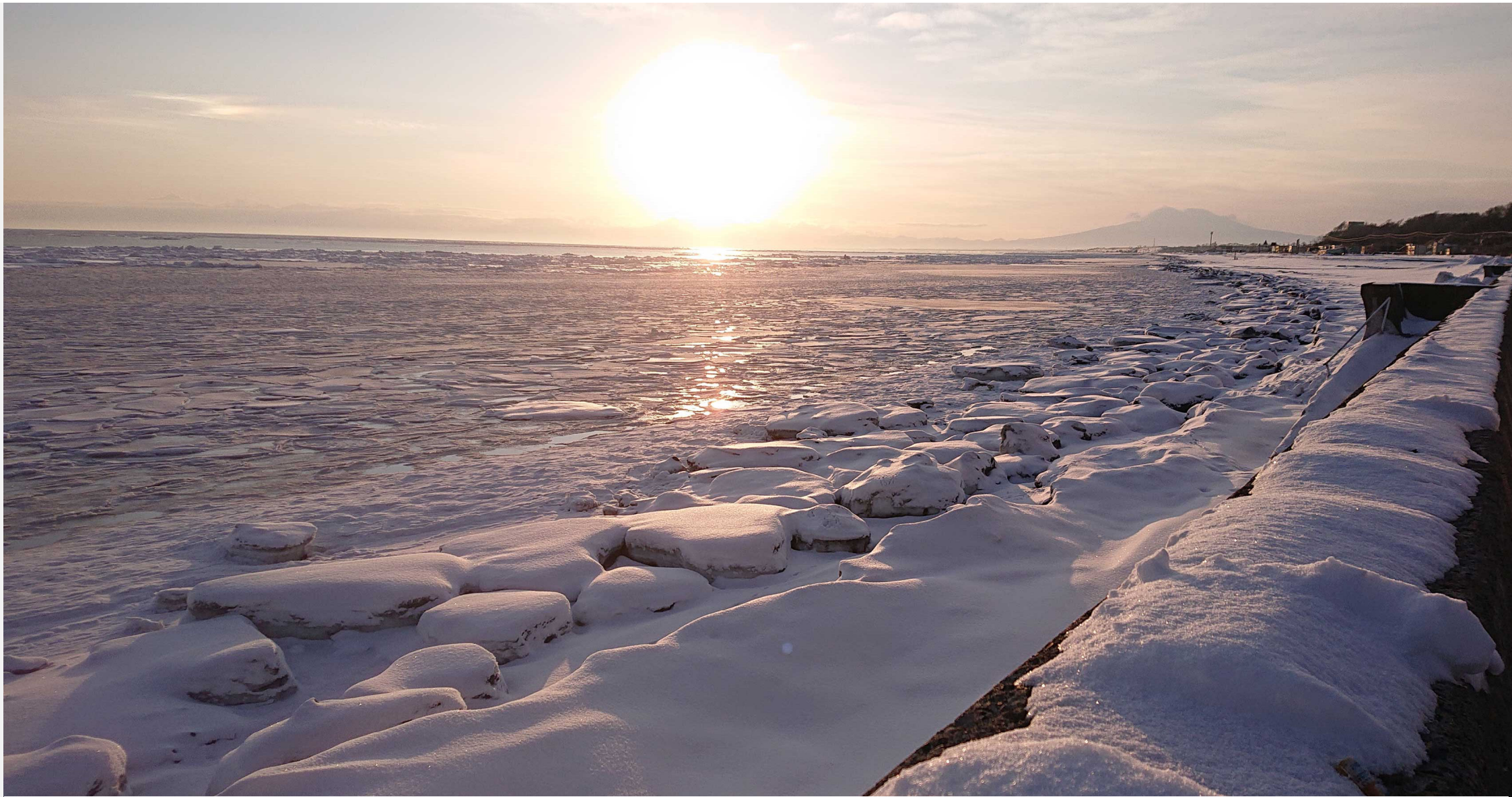
釧網本線鱒浦駅付近 オホーツク海の流氷