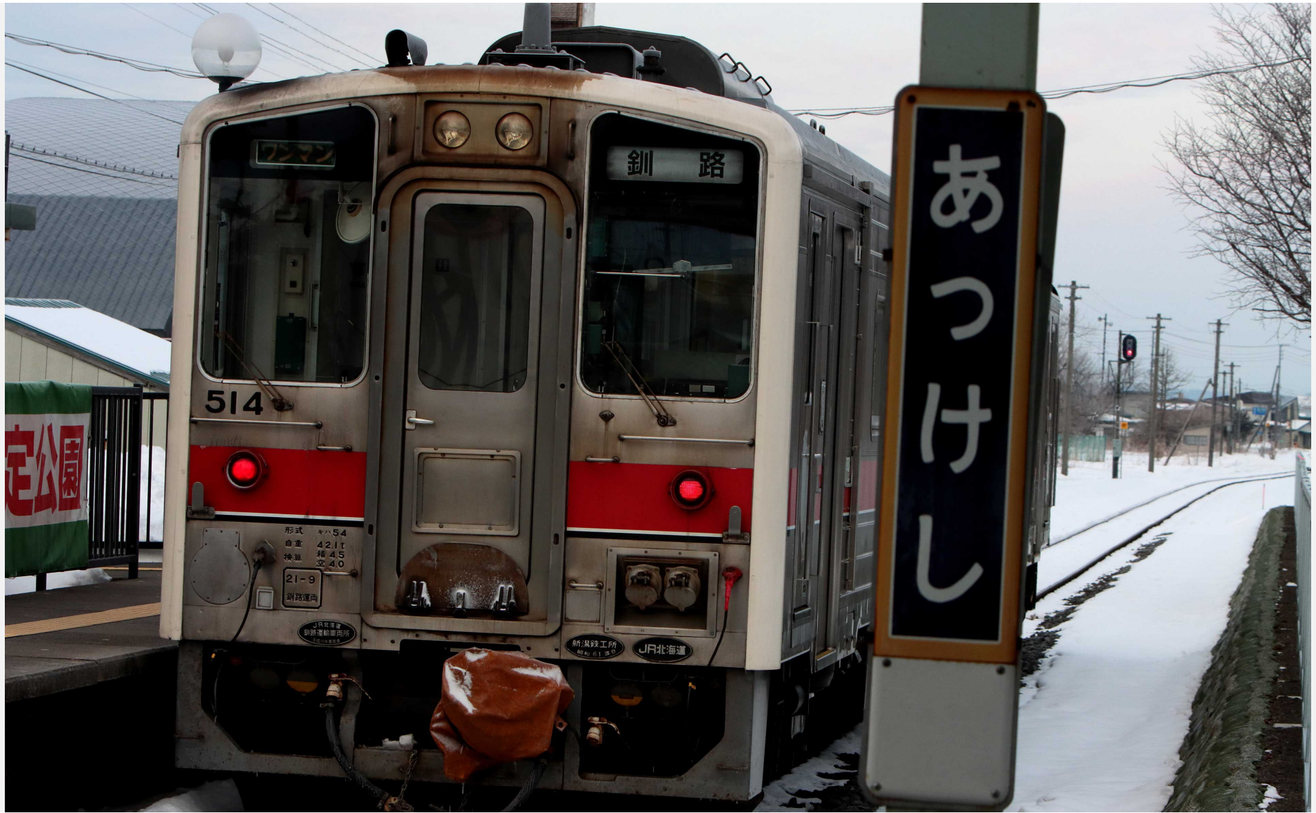
根室本線（花咲線）厚岸駅 キハ54形普通列車 2023年3月