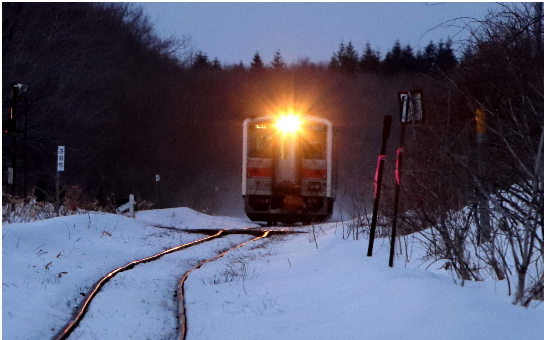
根室本線（花咲線）姉別一浜中 キハ54形普通列車 2023年3月