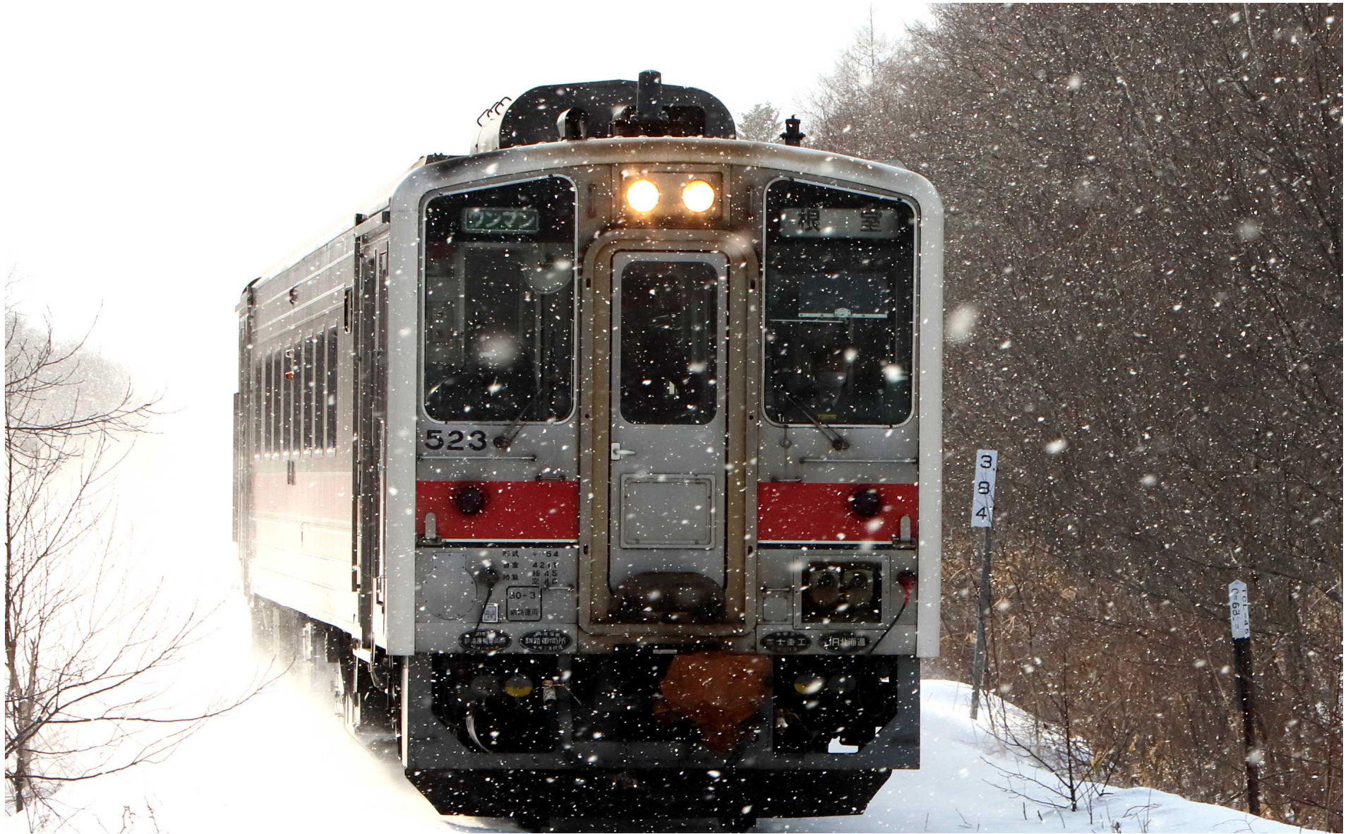
根室本線（花咲線）茶内ー浜中 キハ54形普通列車 2023年3月