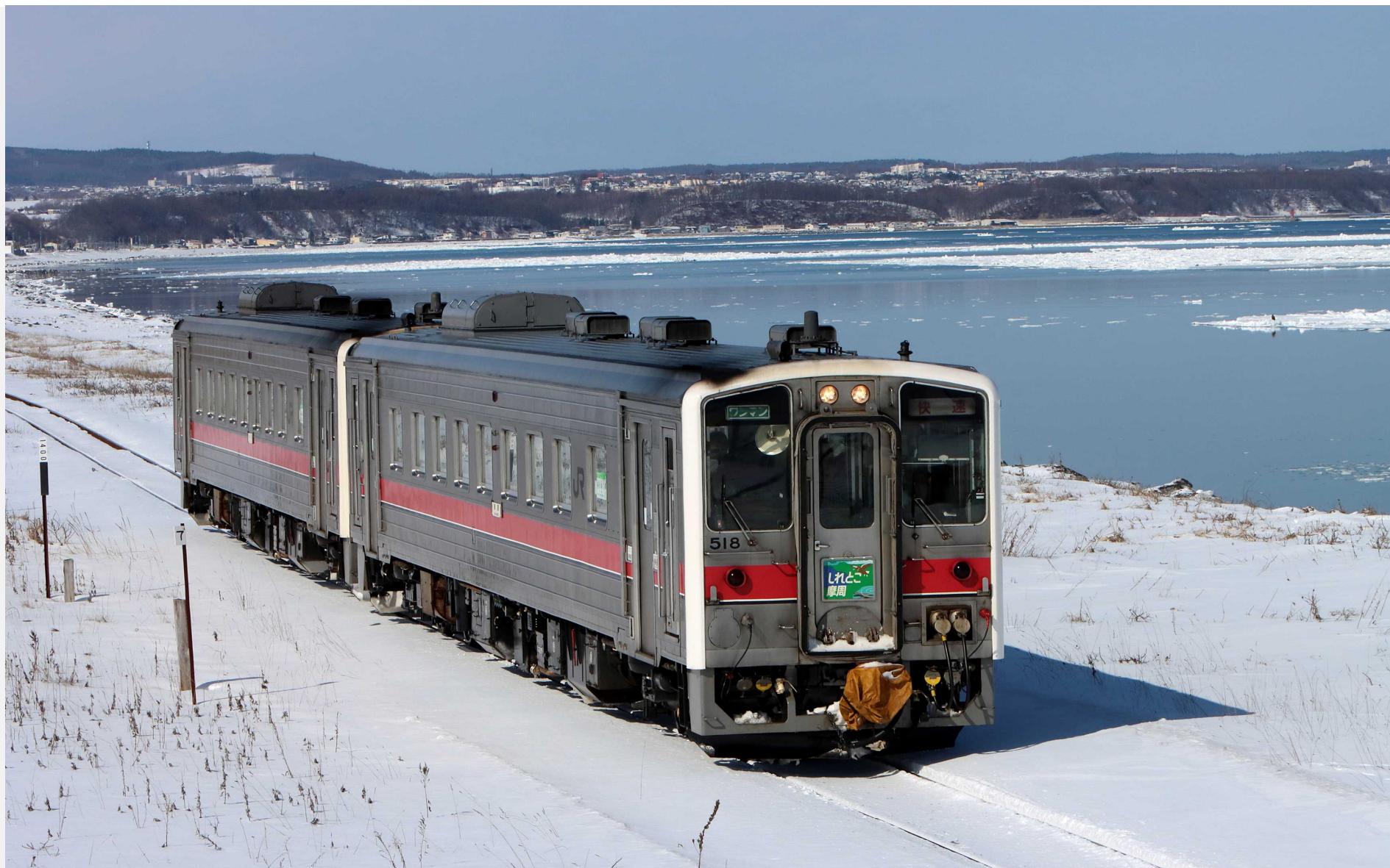
釧網本線藻琴－北浜 キハ54形快速「しれとこ摩周号」 2023年3月