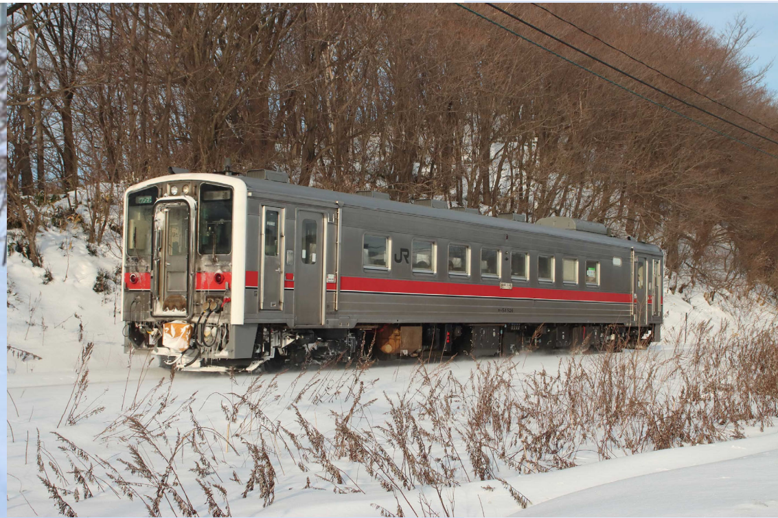
釧網本線藻琴－鱒浦 キハ54形普通列車 2023年3月