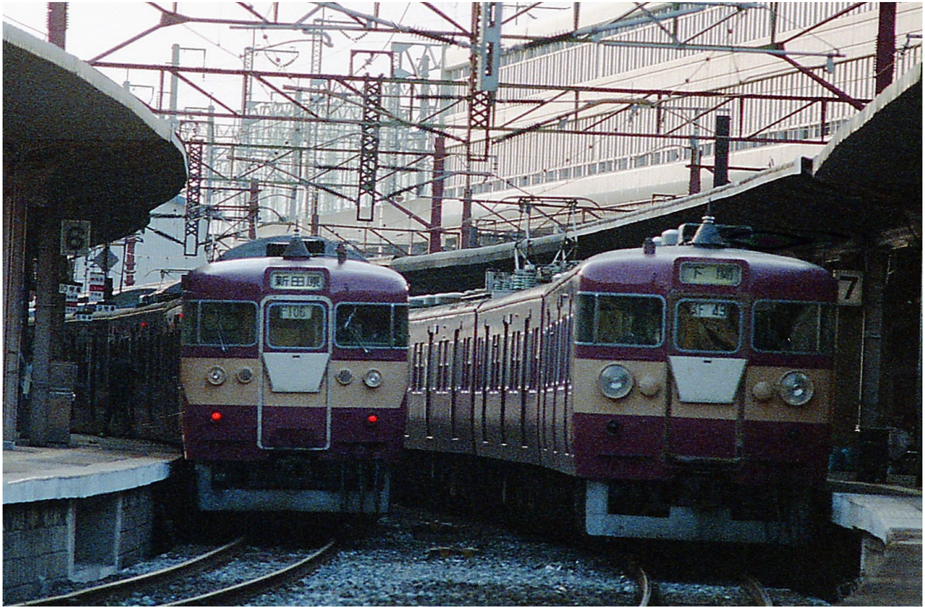
小倉駅（鹿児島本線） 421系普通列車 1985年3月