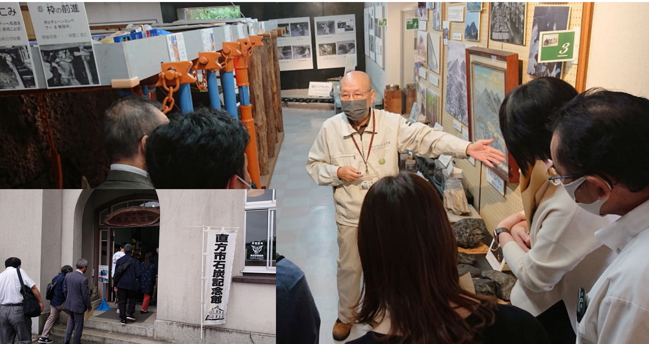
直方市石炭記念館@直方駅近く