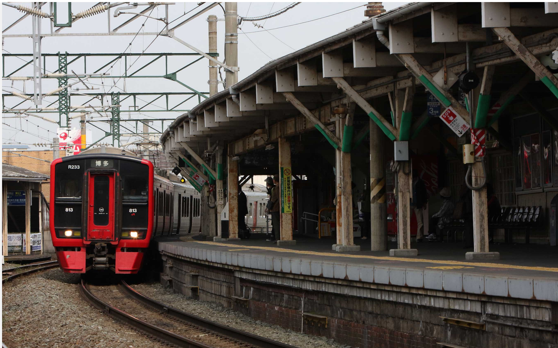
旧折尾駅（鹿児島本線） 813系普通列車 2010年3月