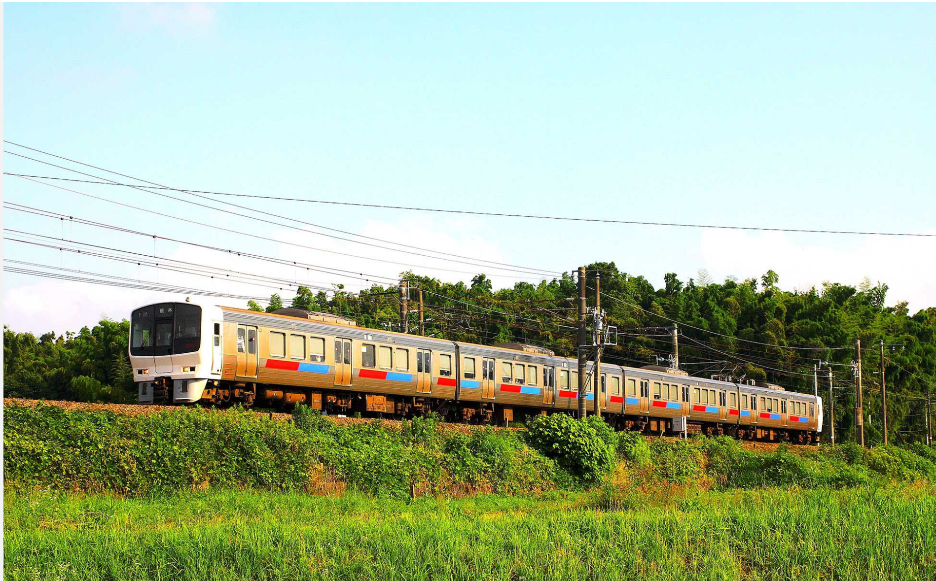
鹿児島本線天拝山一原田 811系普通列車 2018年6月