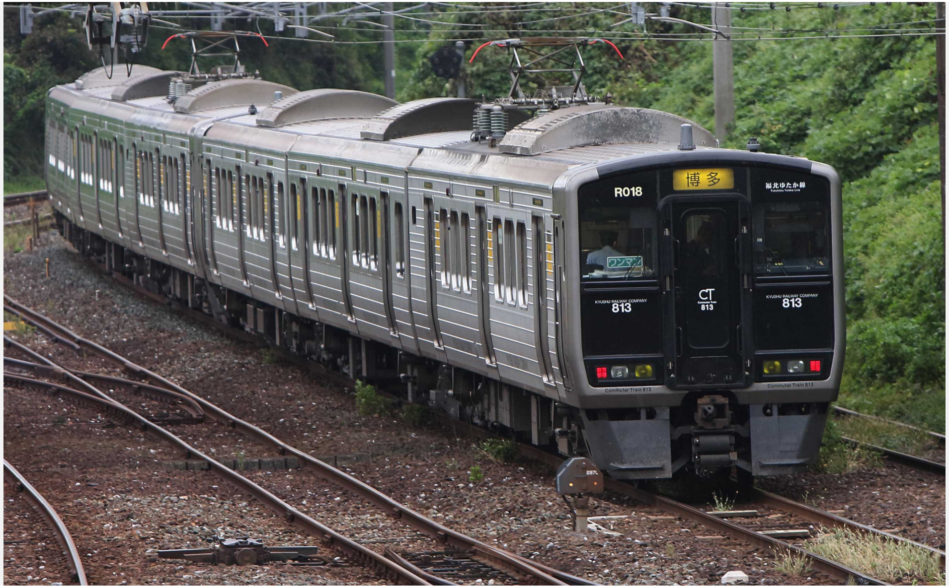
筑豊本線（福北ゆたか線）直方－南直方御殿口 813系普通列車 2022年10月