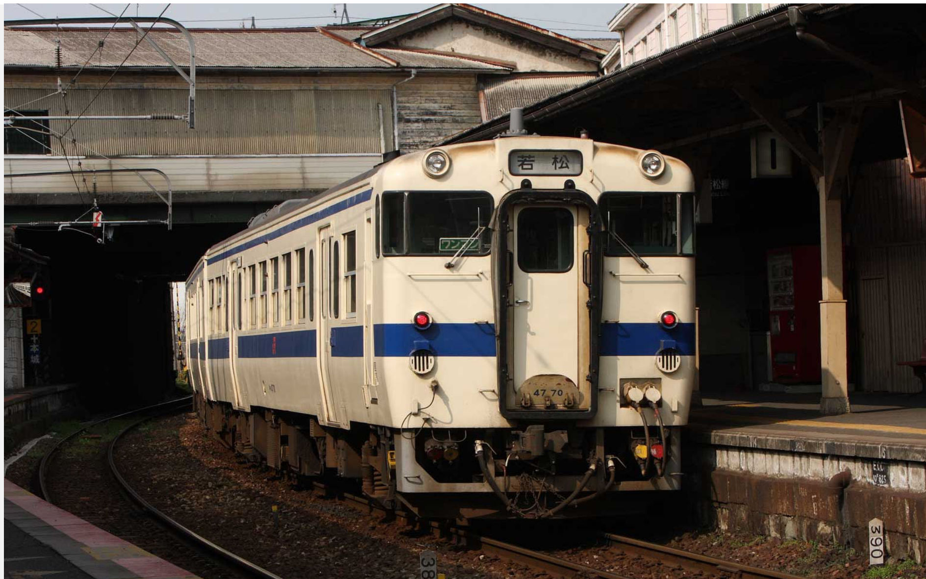
旧折尾駅（筑豊本線） キハ47形普通列車 2010年3月