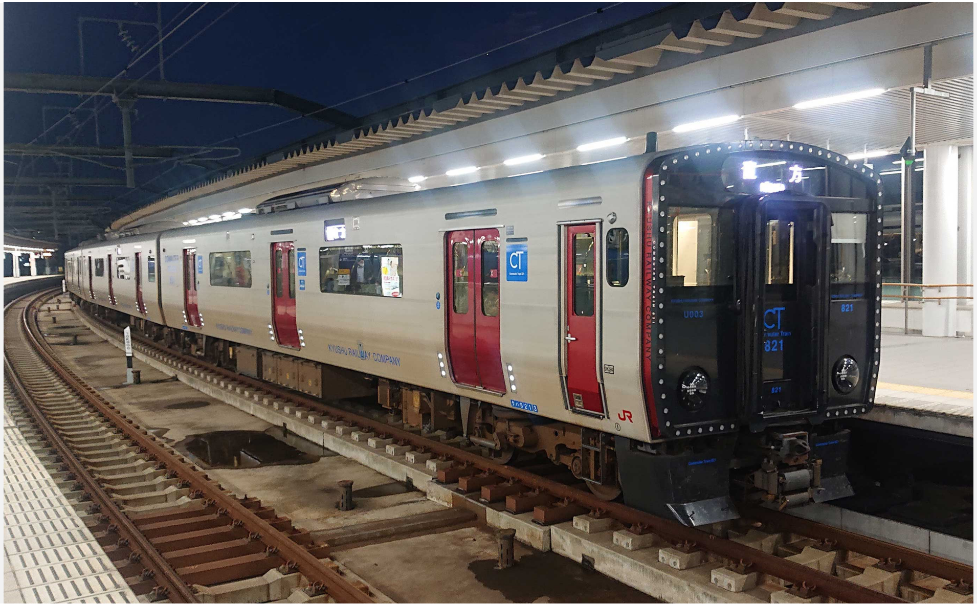
折尾駅（筑豊本線） 821系普通列車 2022年10月