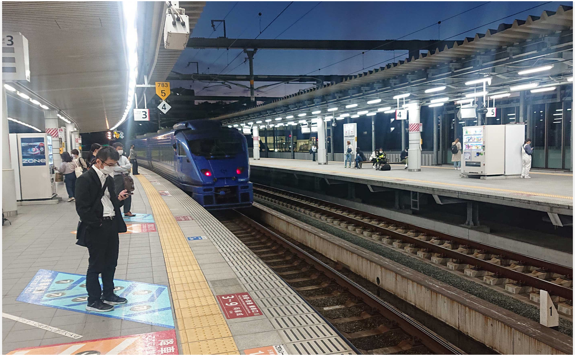
折尾駅（鹿児島本線） 883系特急「ソニック」 2022年10月