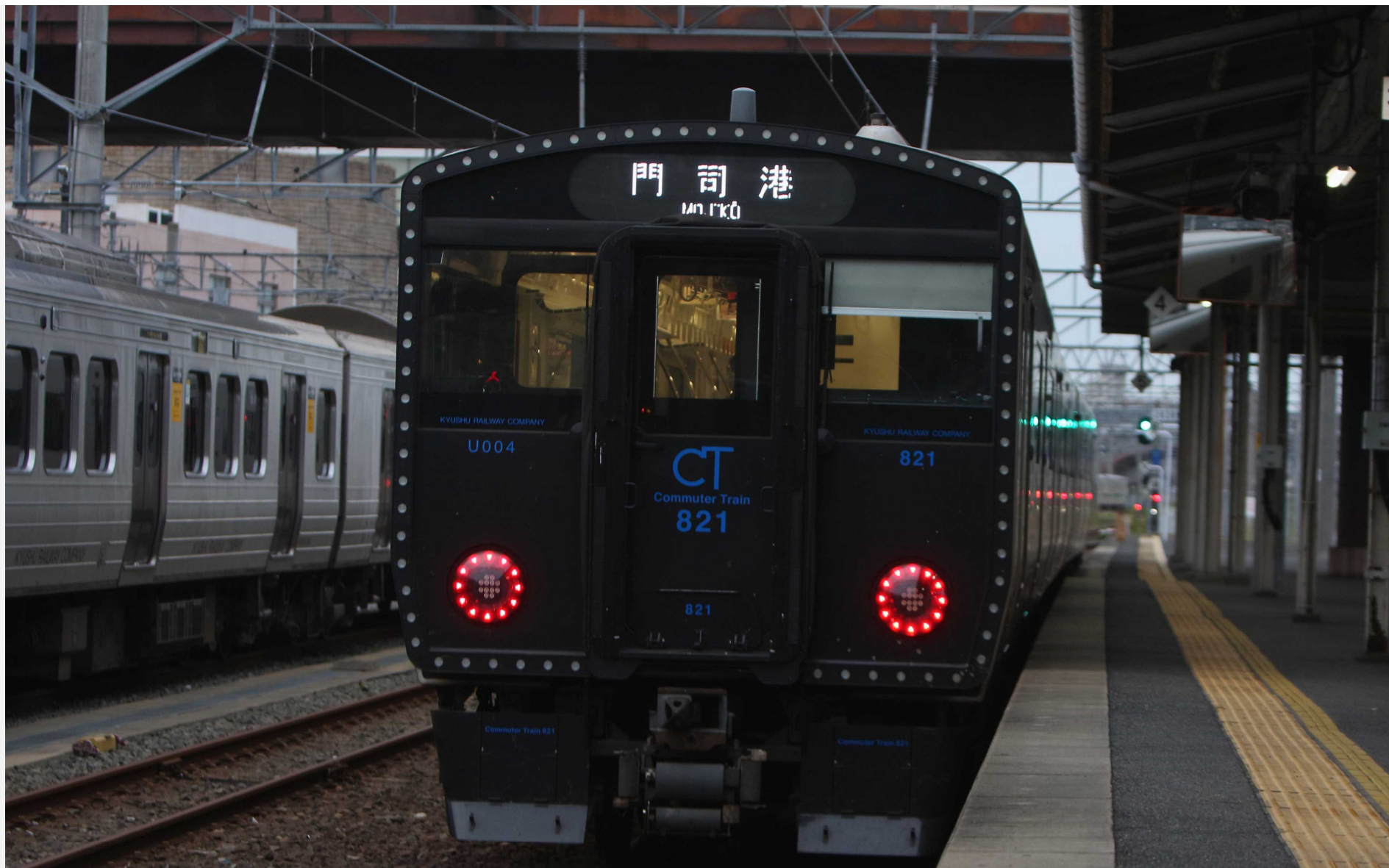
筑豊本線（福北ゆたか線）直方駅 821系普通列車 2022年10月