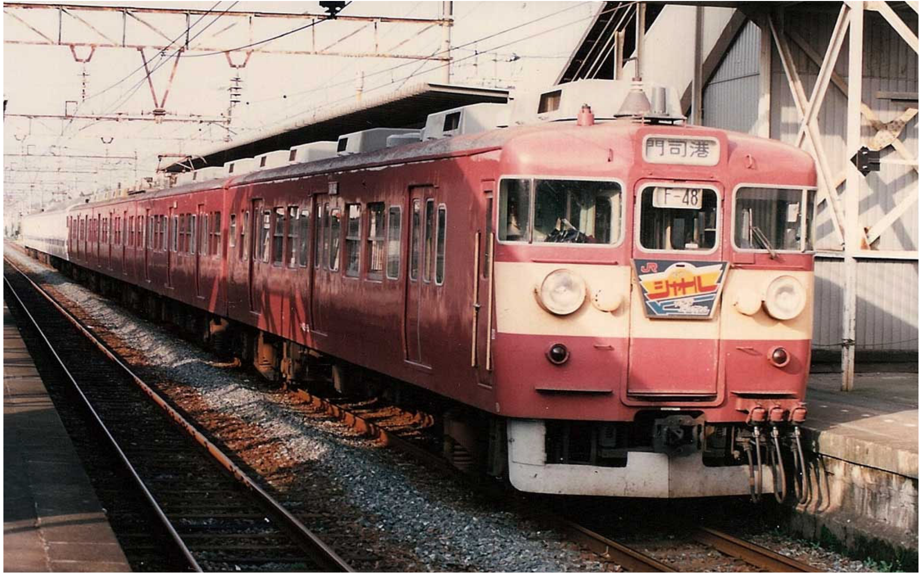
鹿児島本線瀬高駅 421系普通列車「マイタウン」 1988年8月