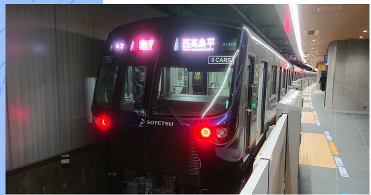
相鉄・東急新横浜駅