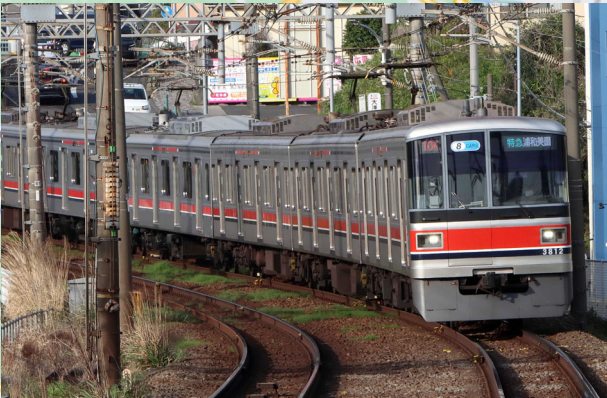
相鉄本線海老名駅入線