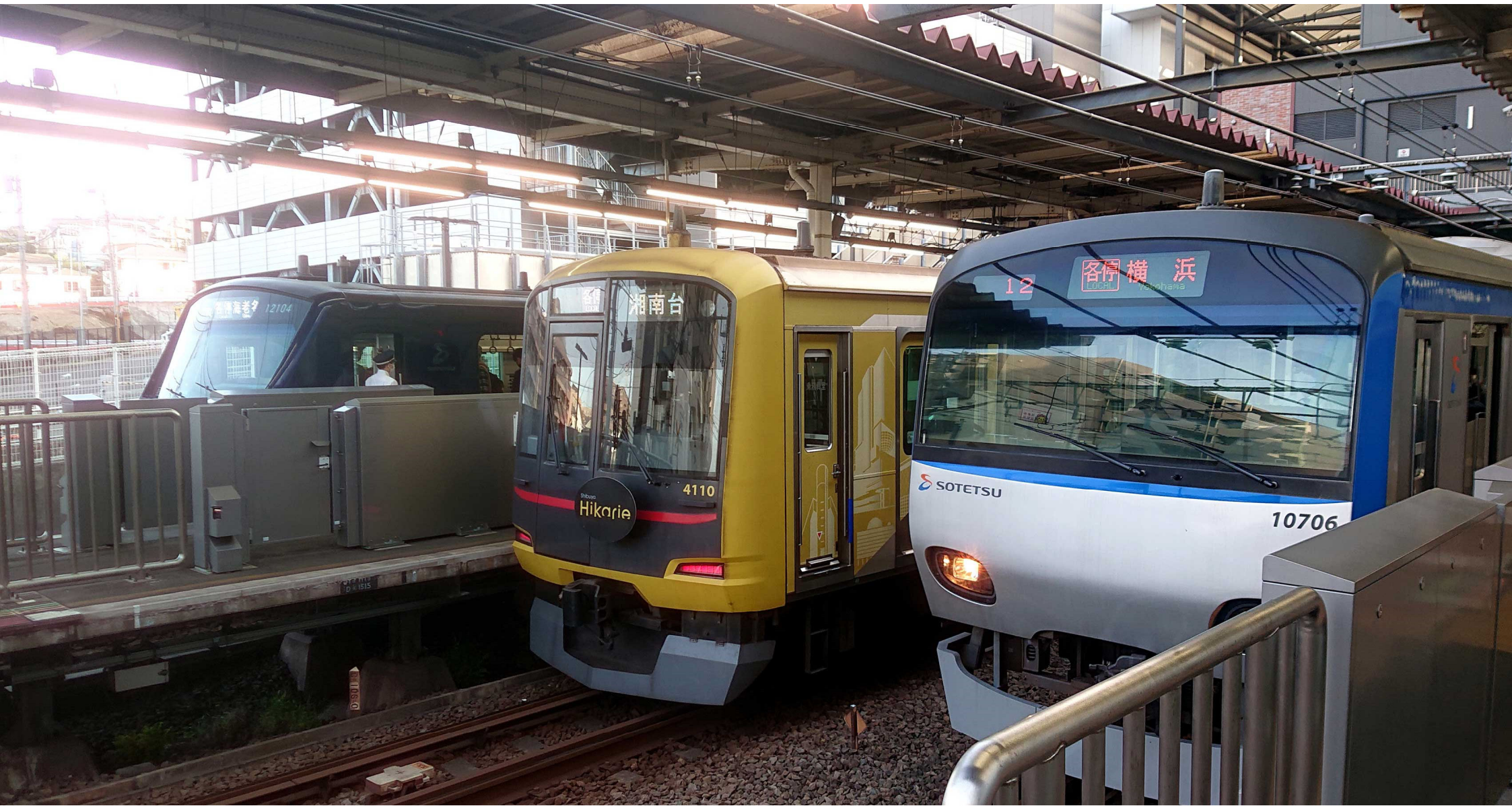
相鉄二俣川駅 (奥から) 相鉄21000系、東急5000系 (渋谷ヒカリエ)、相鉄10000系 2023年4月