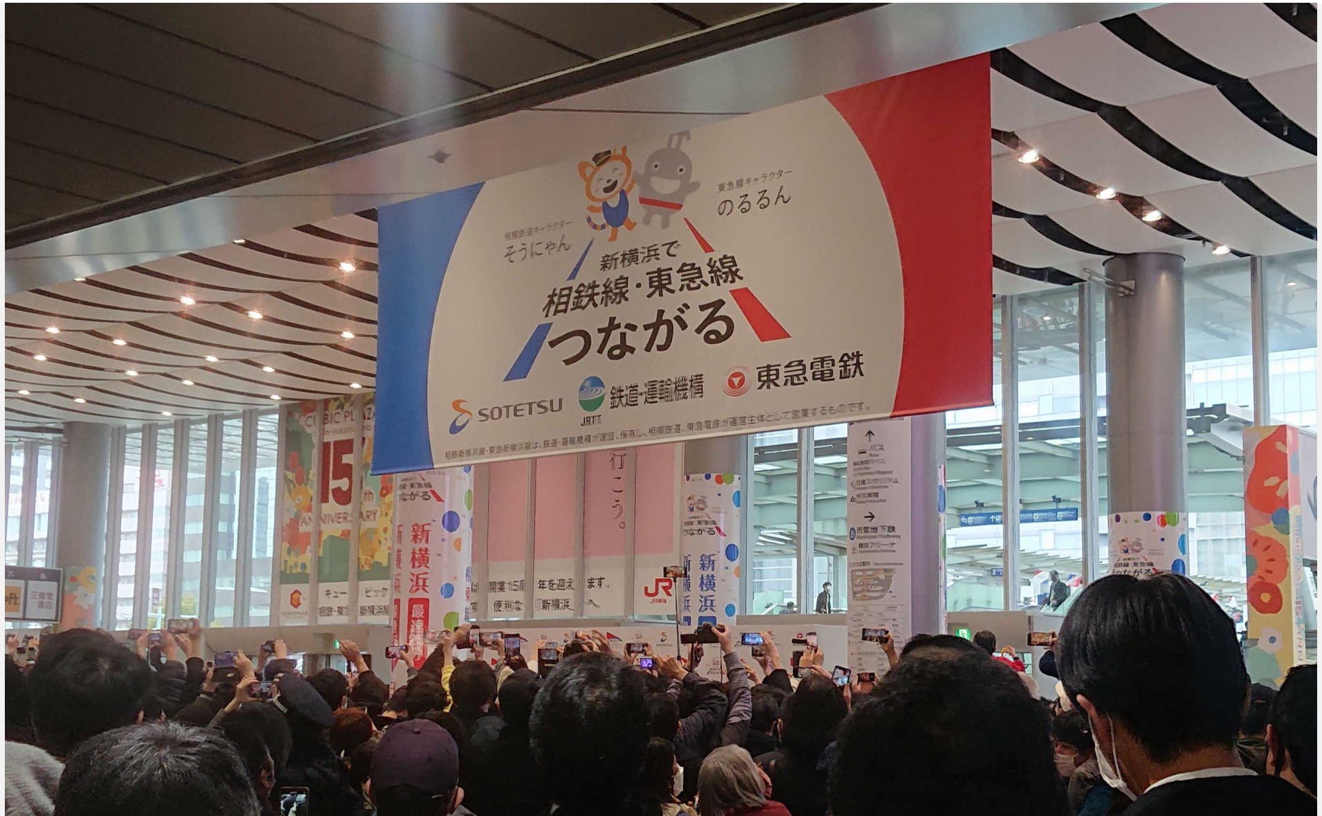
新横浜駅構内 開通式式典会場 2023年3月