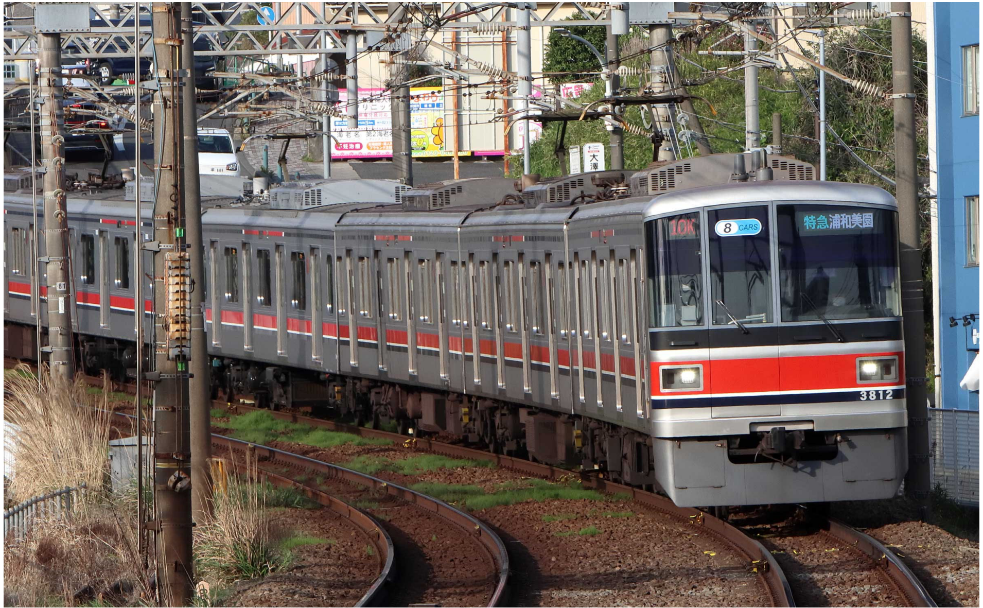
相鉄海老名駅入線 東急3000系特急 2023年4月