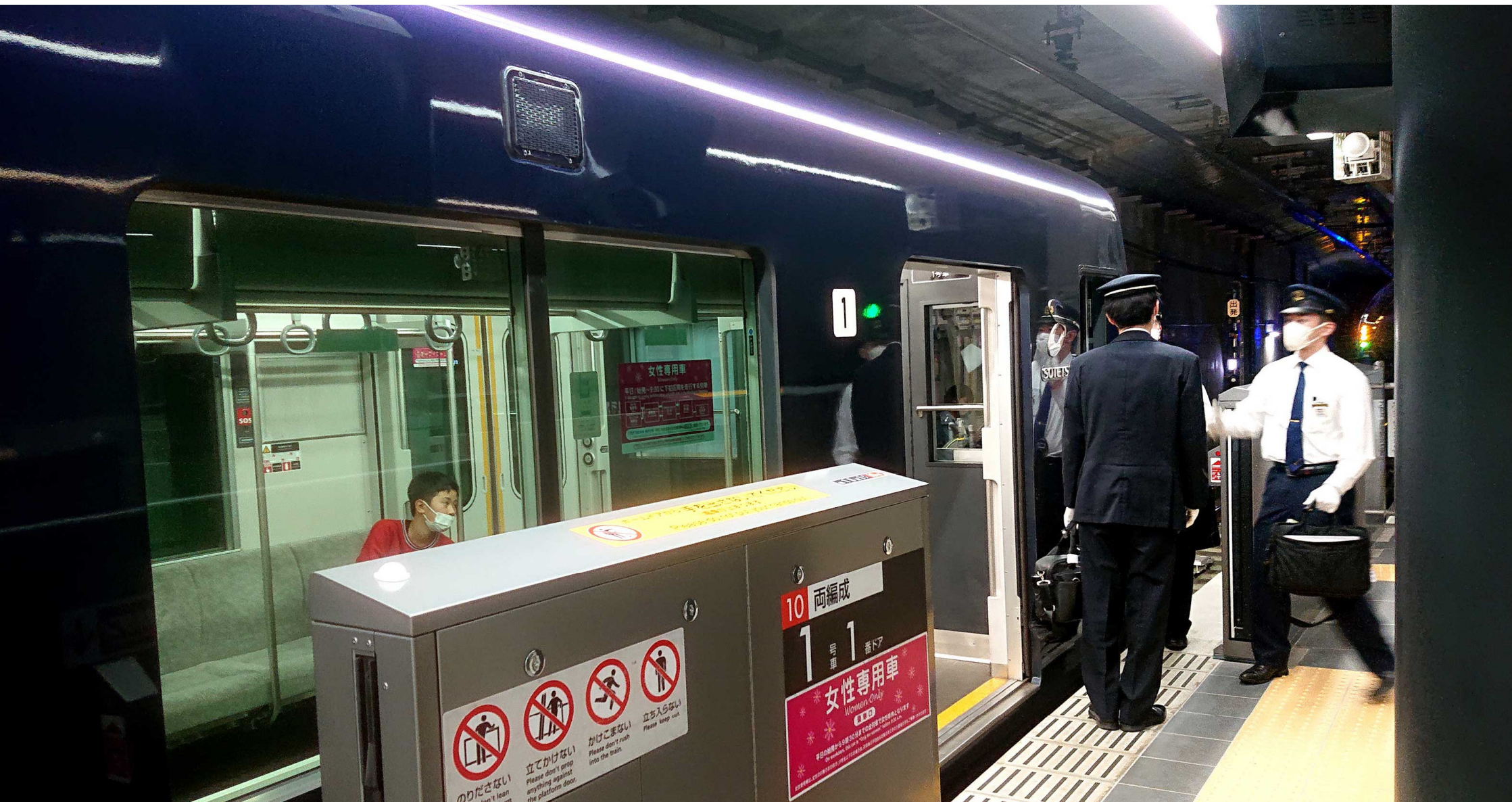
新横浜駅（相鉄・東急ホーム） 相鉄から東急へ運転手交代シーン 2023年4月