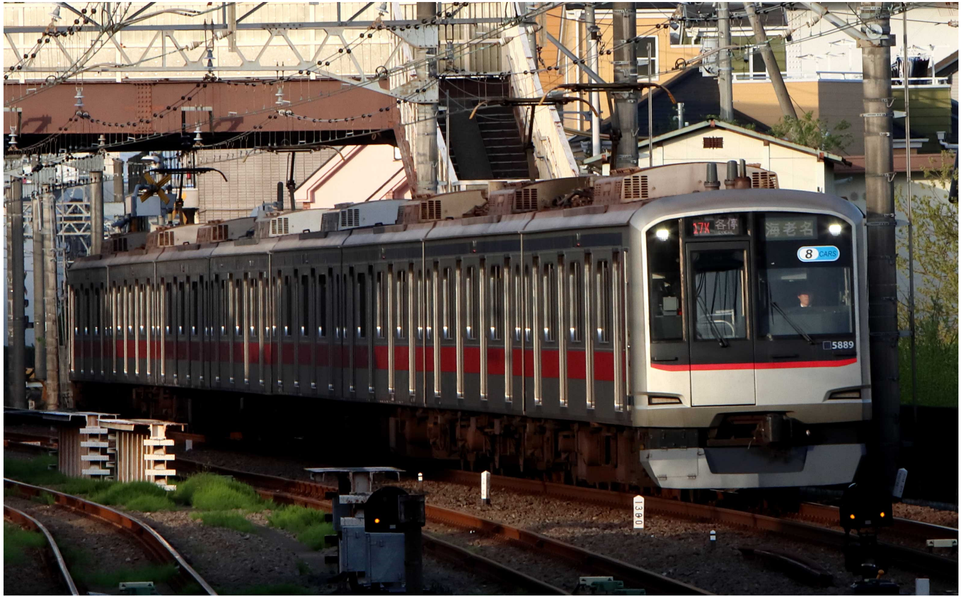
相鉄二俣川駅入線 東急5000系普通列車 2023年4月