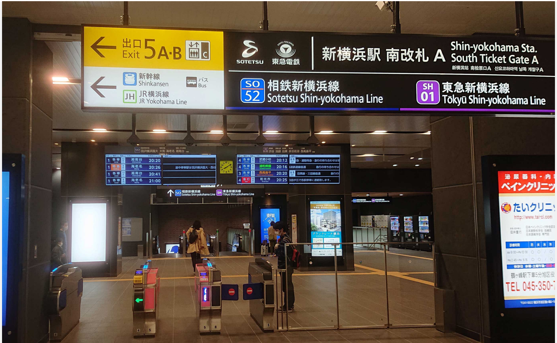
新横浜駅 相鉄・東急改札口 2023年3月