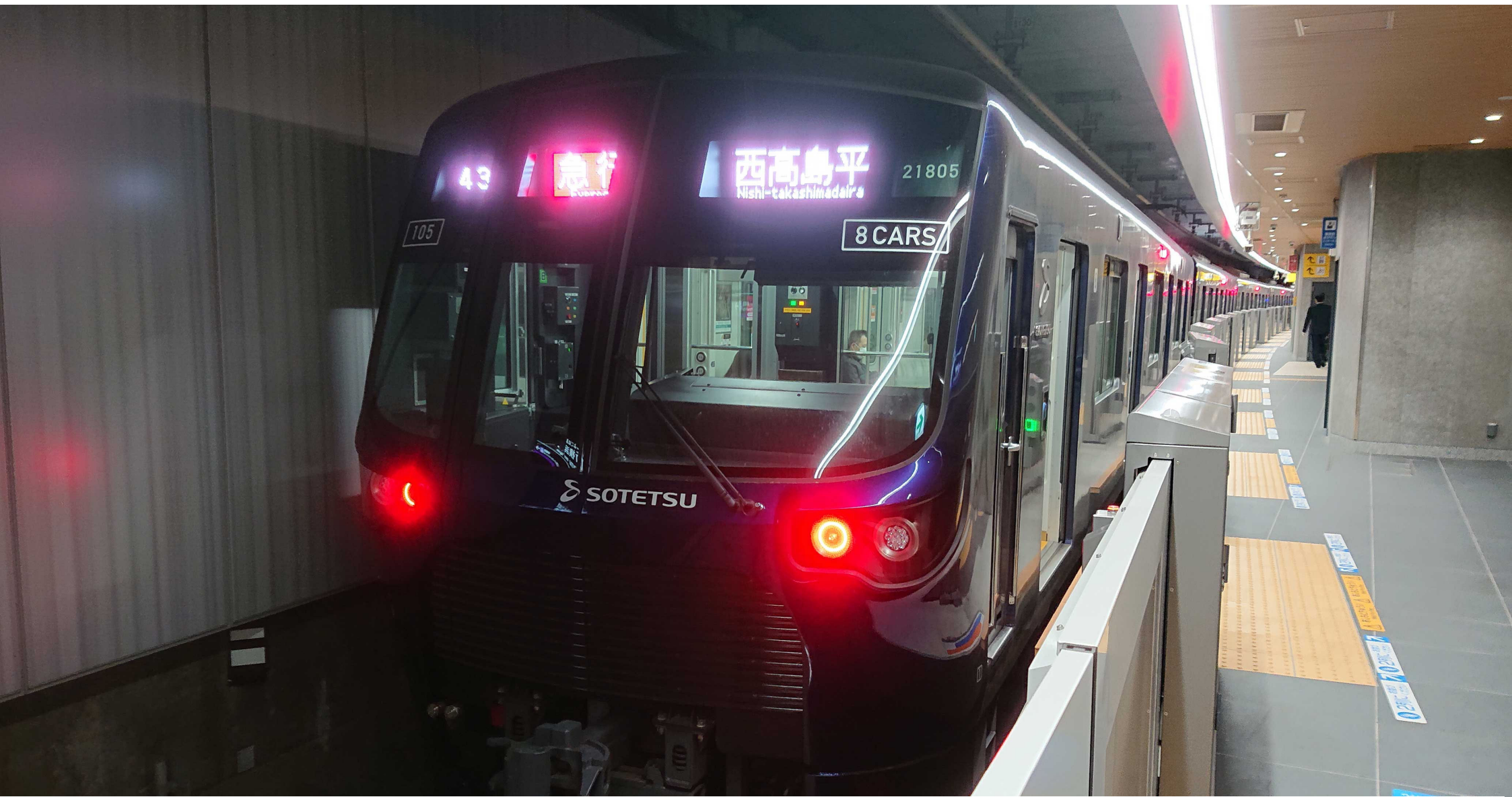
新横浜駅（相鉄・東急ホム） 相鉄21000系急行列車 2023年4月