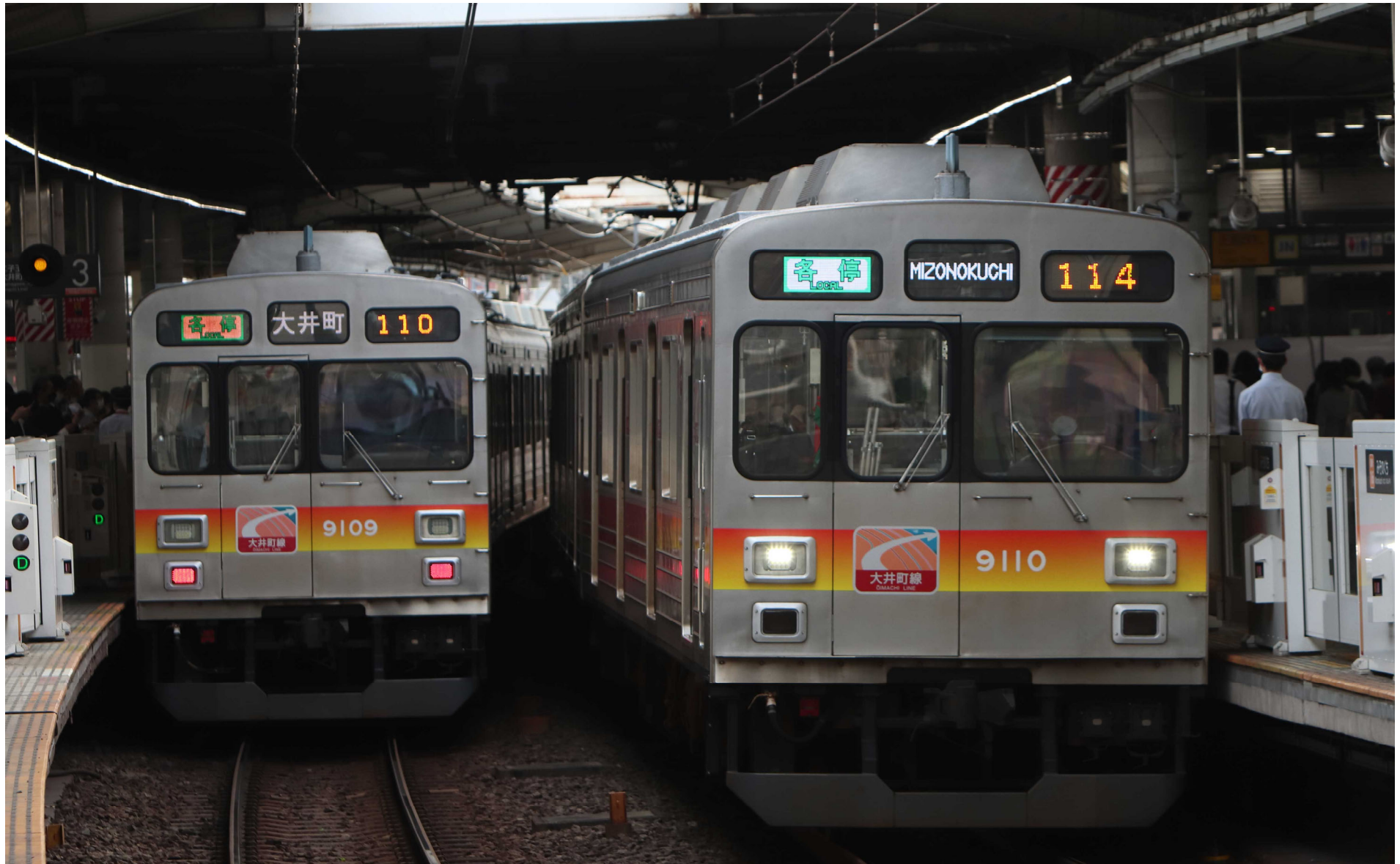
東急田園都市線溝の口駅 東急9000系普通列車 2023年5月