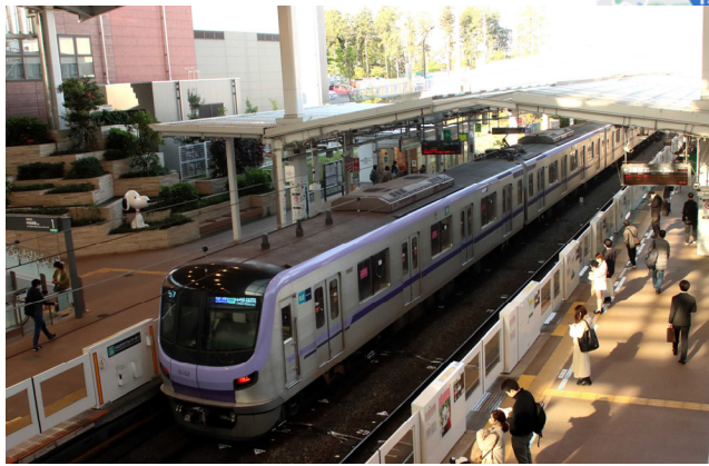
南町田グランベリーパーク駅