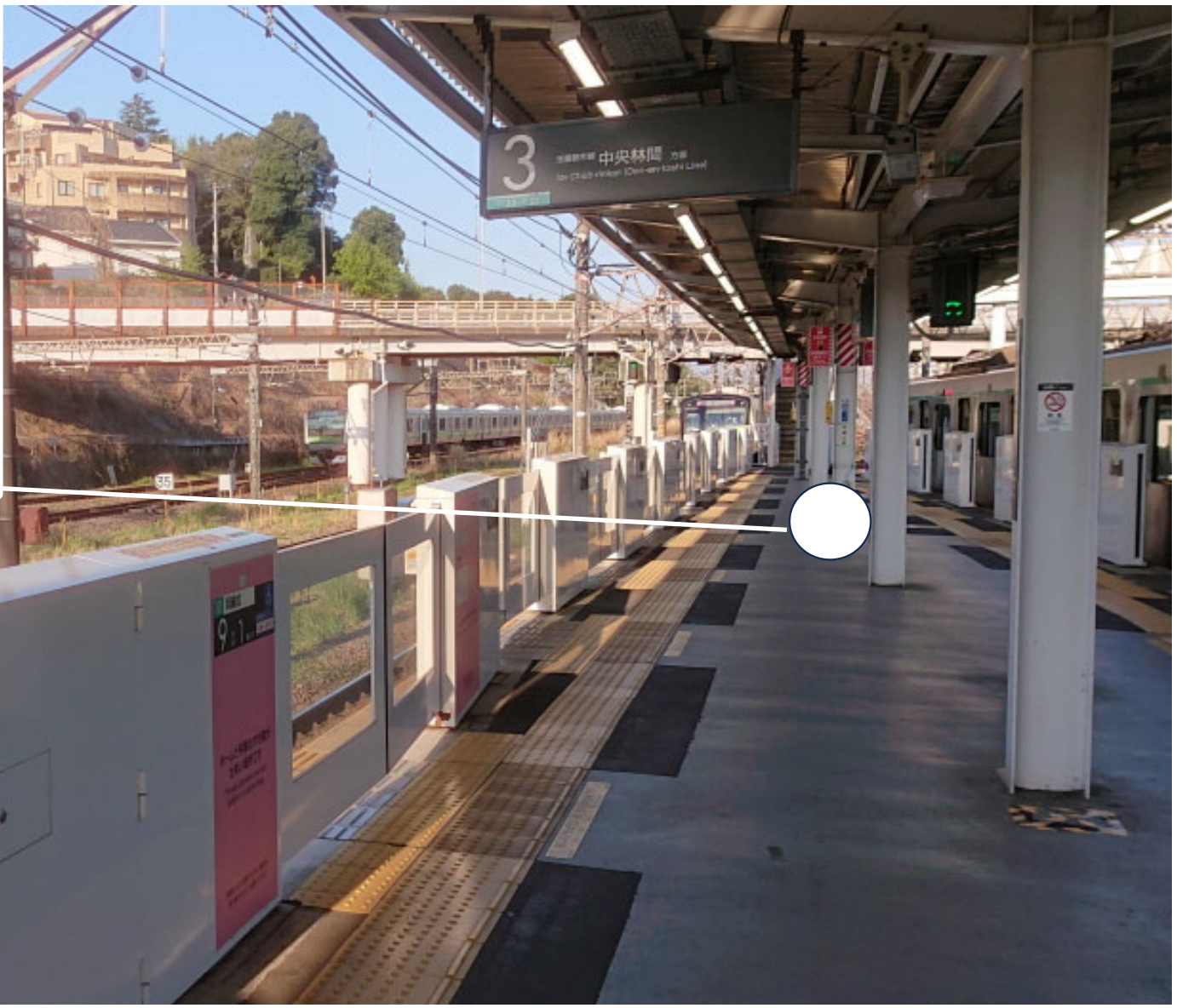
東急田園都市線長津田駅 2023年4月