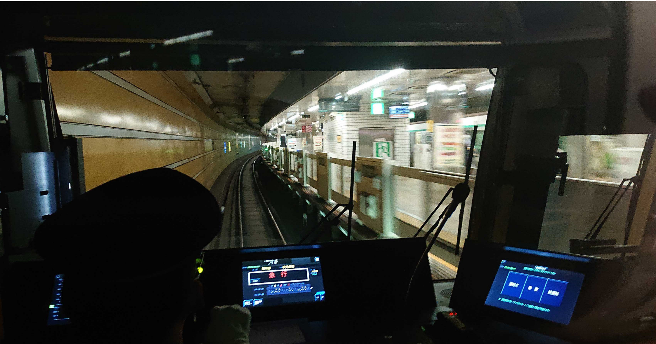
東急中央林間駅 東急2020系普通列車・車内から 2022年12月