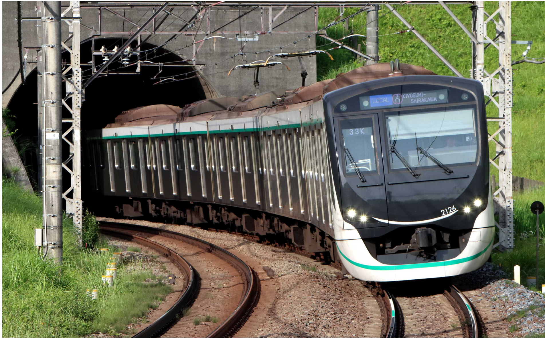
東急田園都市線あざみ野ーたまプラーザ 東急2020系普通列車 2023年5月