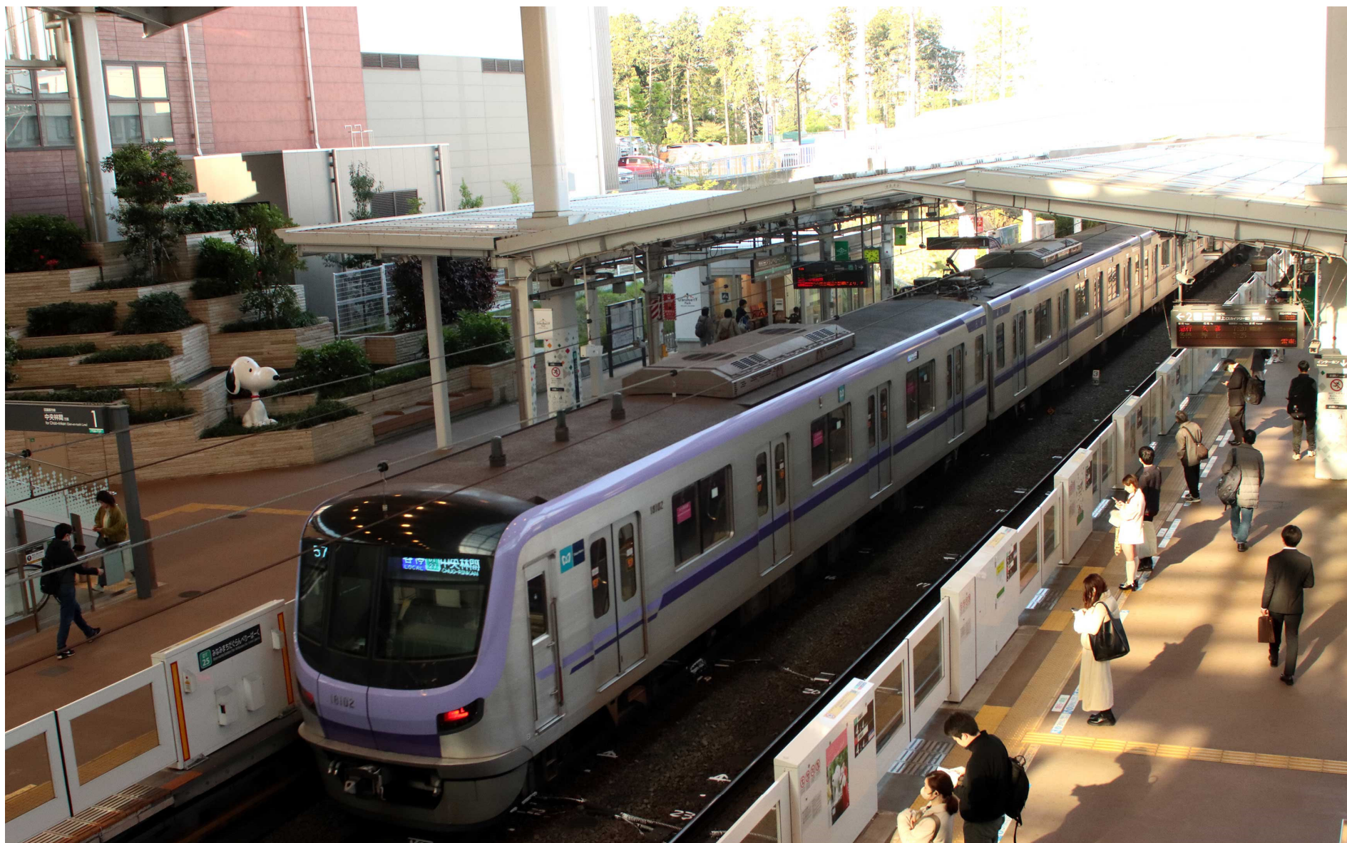
東急田園都市線南町田グランベリーパーク駅 東京メトロ18000系普通列車 2023年4月