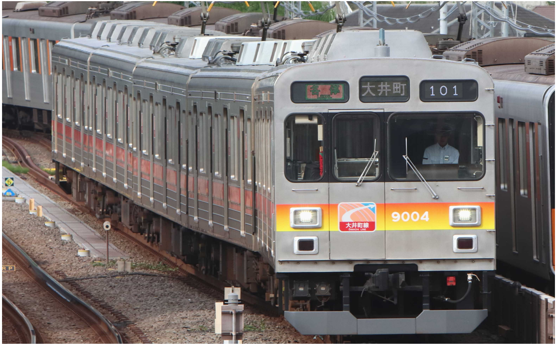
東急大井町線溝の口駅構内 東急9000系 2023年5月