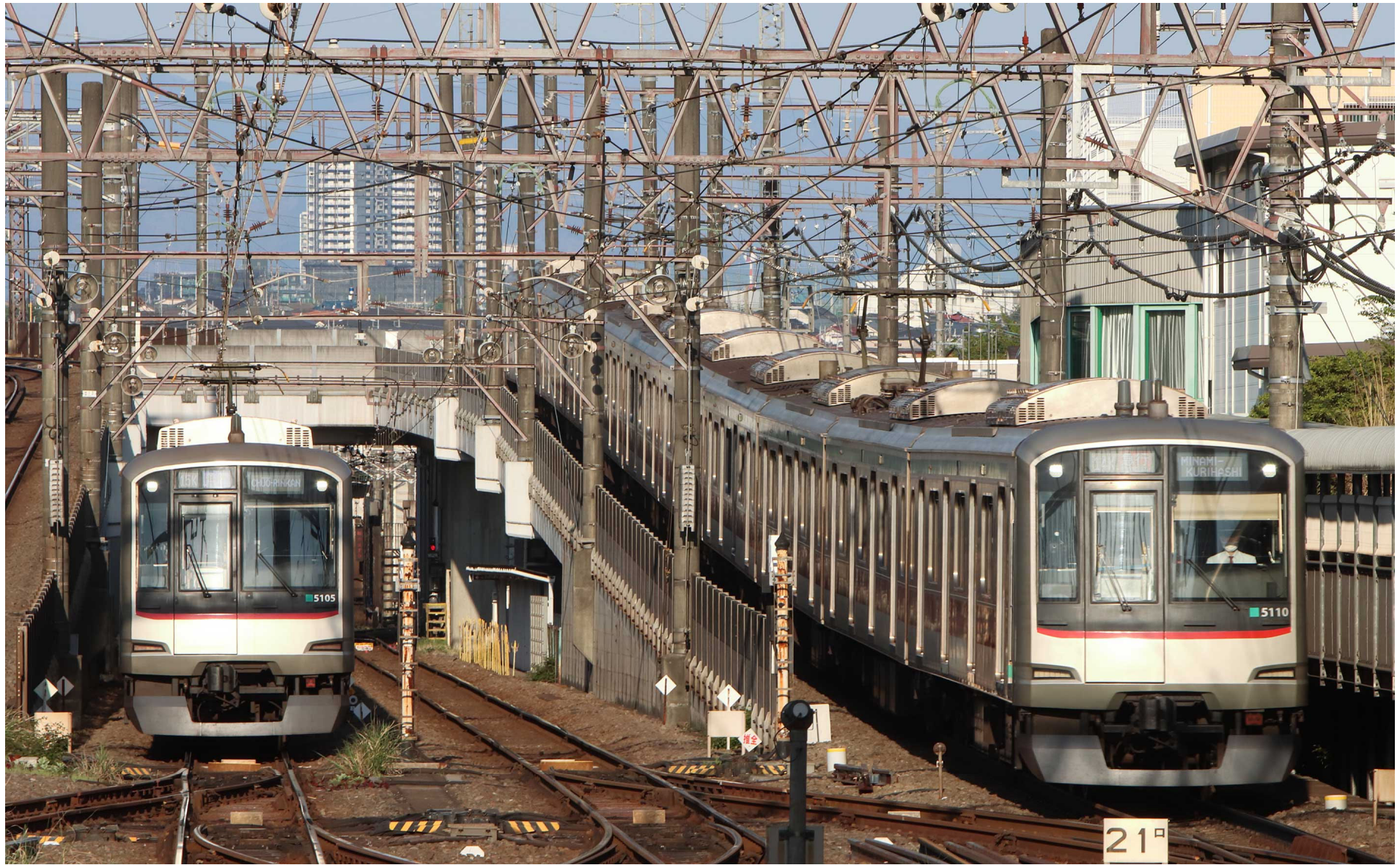
東急田園都市線長津田駅 東急5000系列車 2023年4月