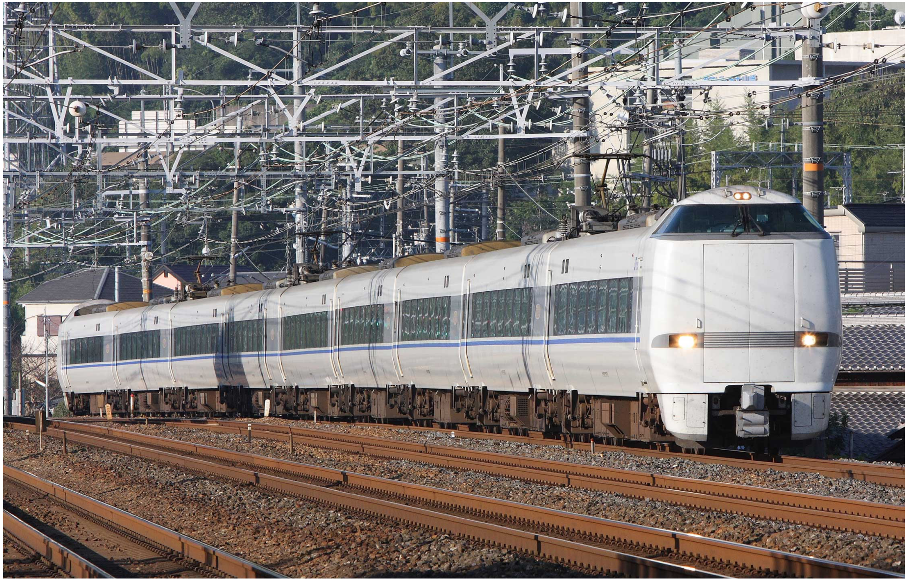
東海道本線山崎－長岡京 683系特急「サンダーバード」 2011年9月