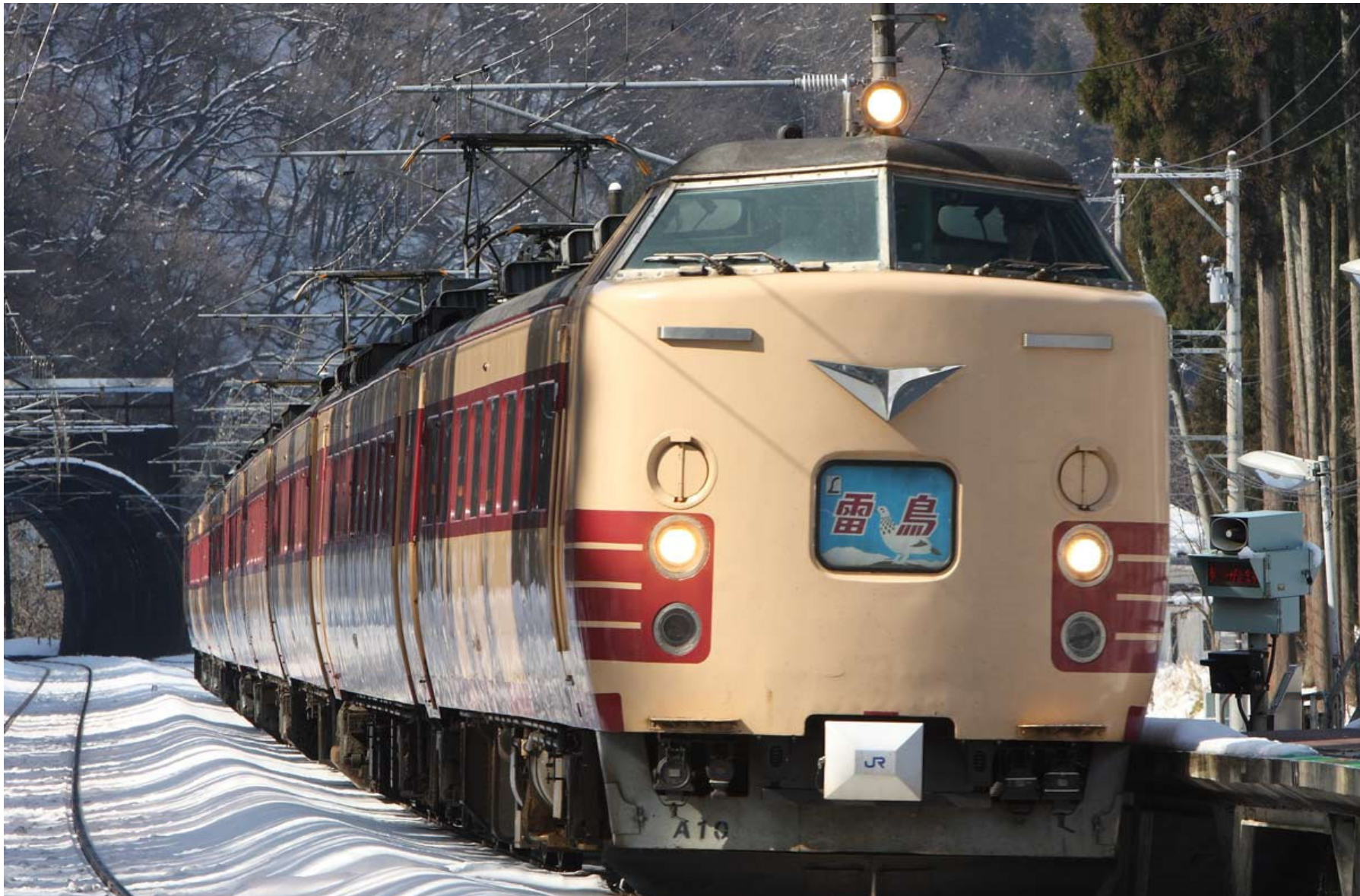
北陸本線南今庄駅 485系特急「雷鳥」 2010年2月