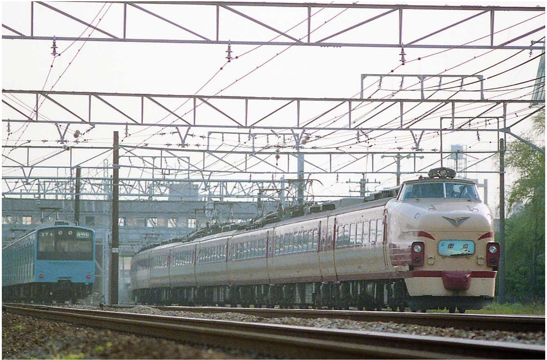
東海道本線 摂津富田 - 高槻 485系ボンネット型特急「雷鳥」 1985年5月