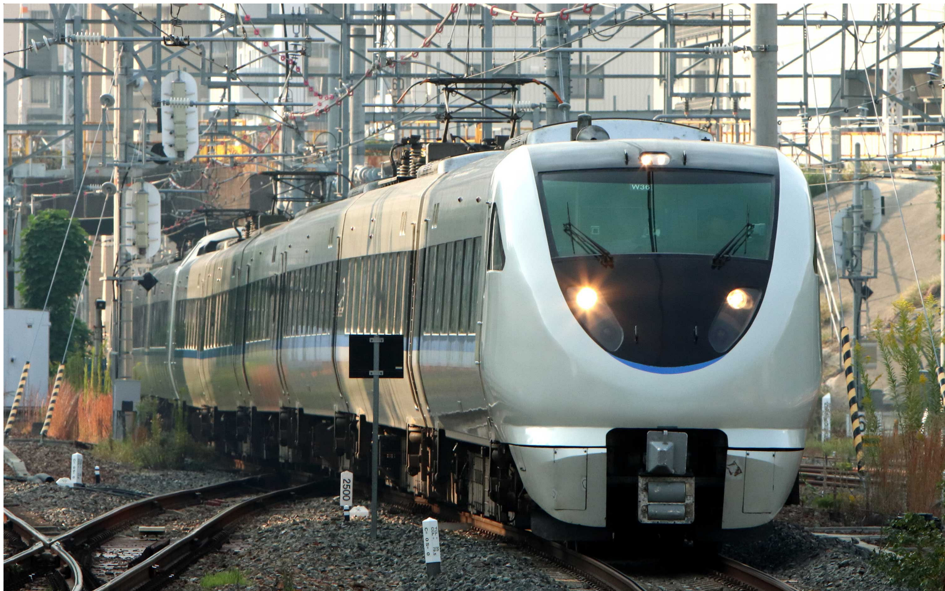
東海道本線新大阪駅入線 683系特急「サンダーバード」 2023年11月