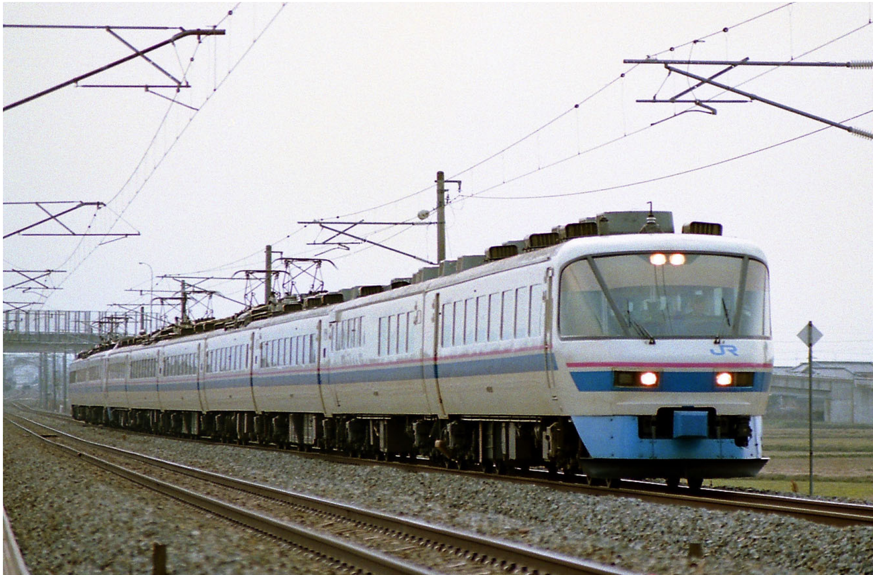
北陸本線加賀温泉一動橋 485系特急「スーパー雷鳥」 1995年3月