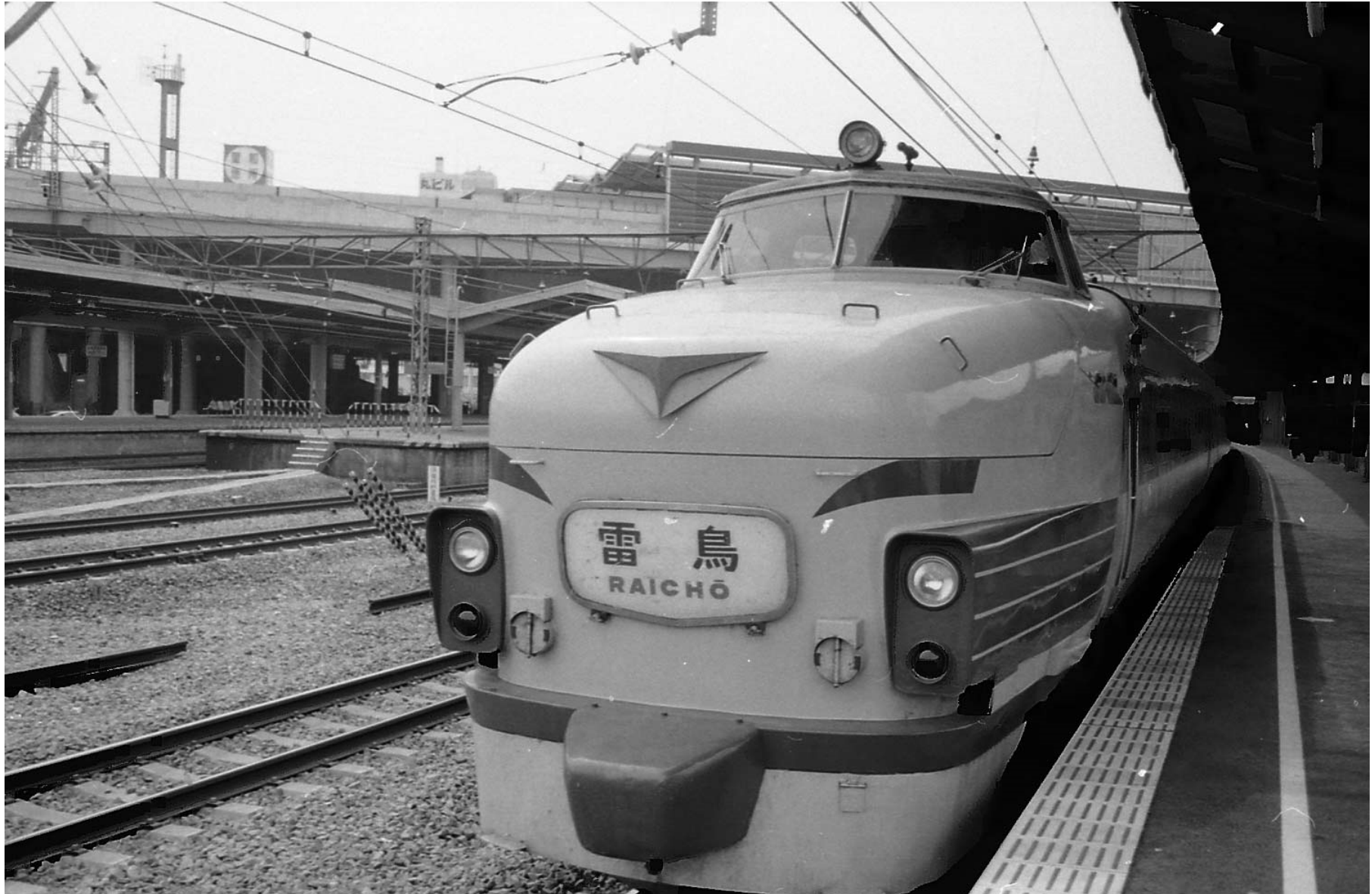
東海道本線新大阪駅 485系（ボンネット）特急「雷鳥」 1977年