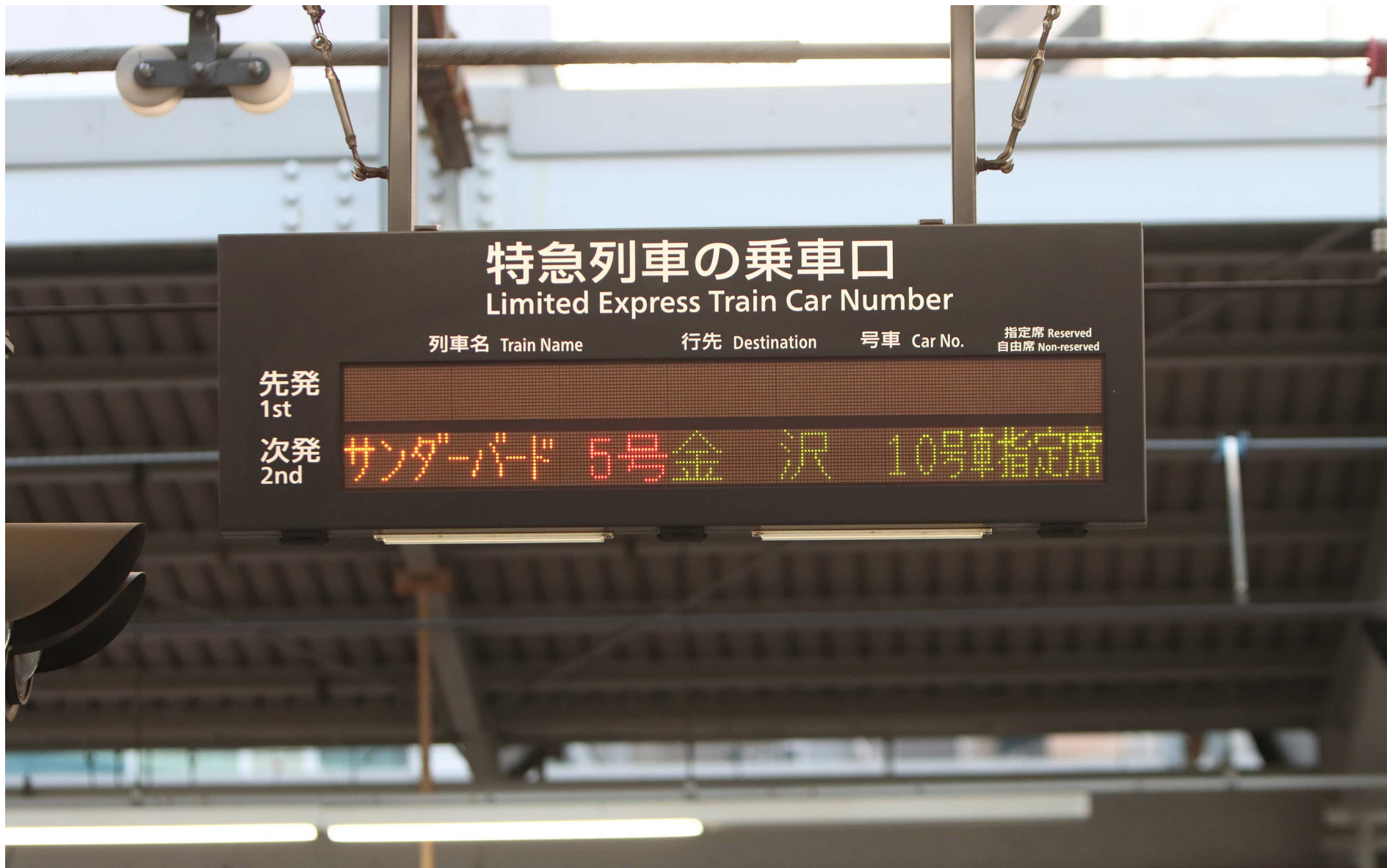
東海道本線新大阪駅 ホーム上の案内表示 2023年11月