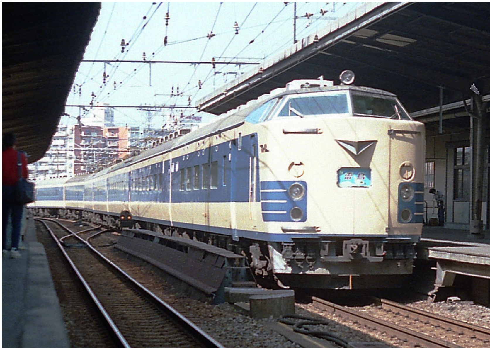
大阪駅 583系特急「雷鳥」 1985年4月