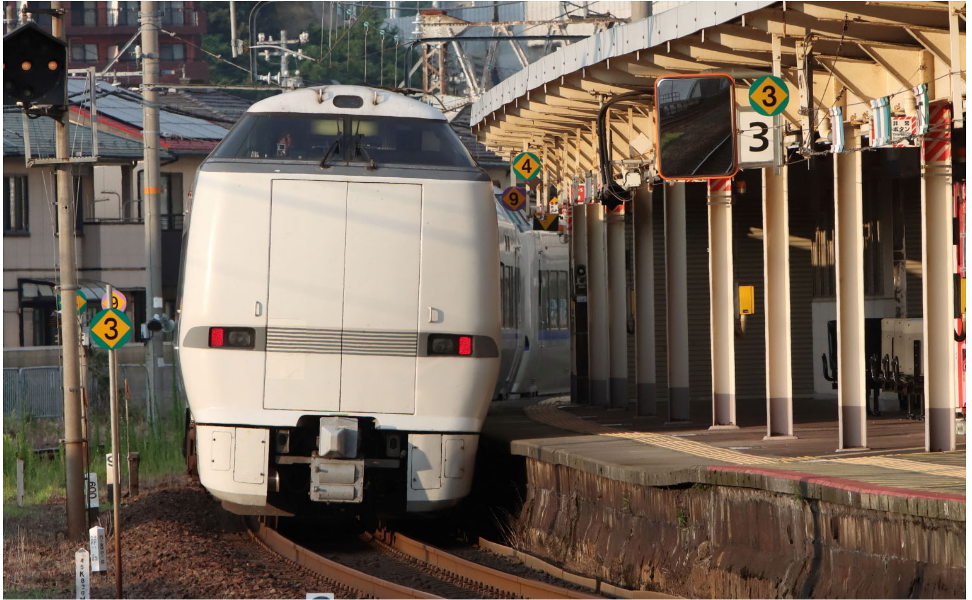
北陸本線敦賀駅 683系特急「サンダーバード」 2023年7月