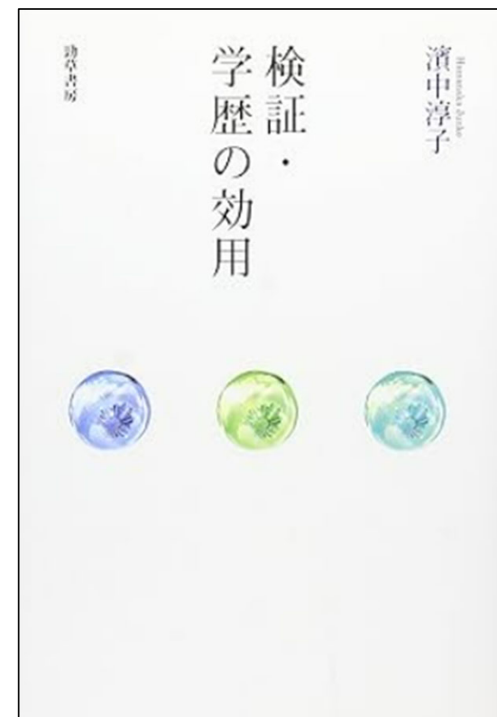
濱中淳子 (2013) 『検証・学歴の効用』 (勁草書房)

東京大学大学院教育学研究科博士課程修了、博士(教育学)。専門は、教育社会学、高等教育論。主な著書に、『「超」進学校 開成・灘の卒業生』(ちくま新書、2016年)など。いわゆる進学校に着目し、卒業生調査を用い高校時代の経験とキャリアの関連性を分析する他、『大学入試改革は高校生の学習行動を変えるか』(共著、ミネルヴァ書房、2019年)では、高校生の学習行動を進学校や部活動との関連から分析・発表している。