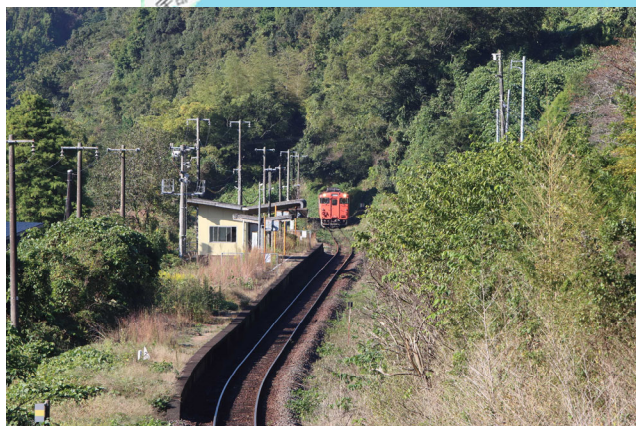
高水 - 米川 キハ40形普通列車