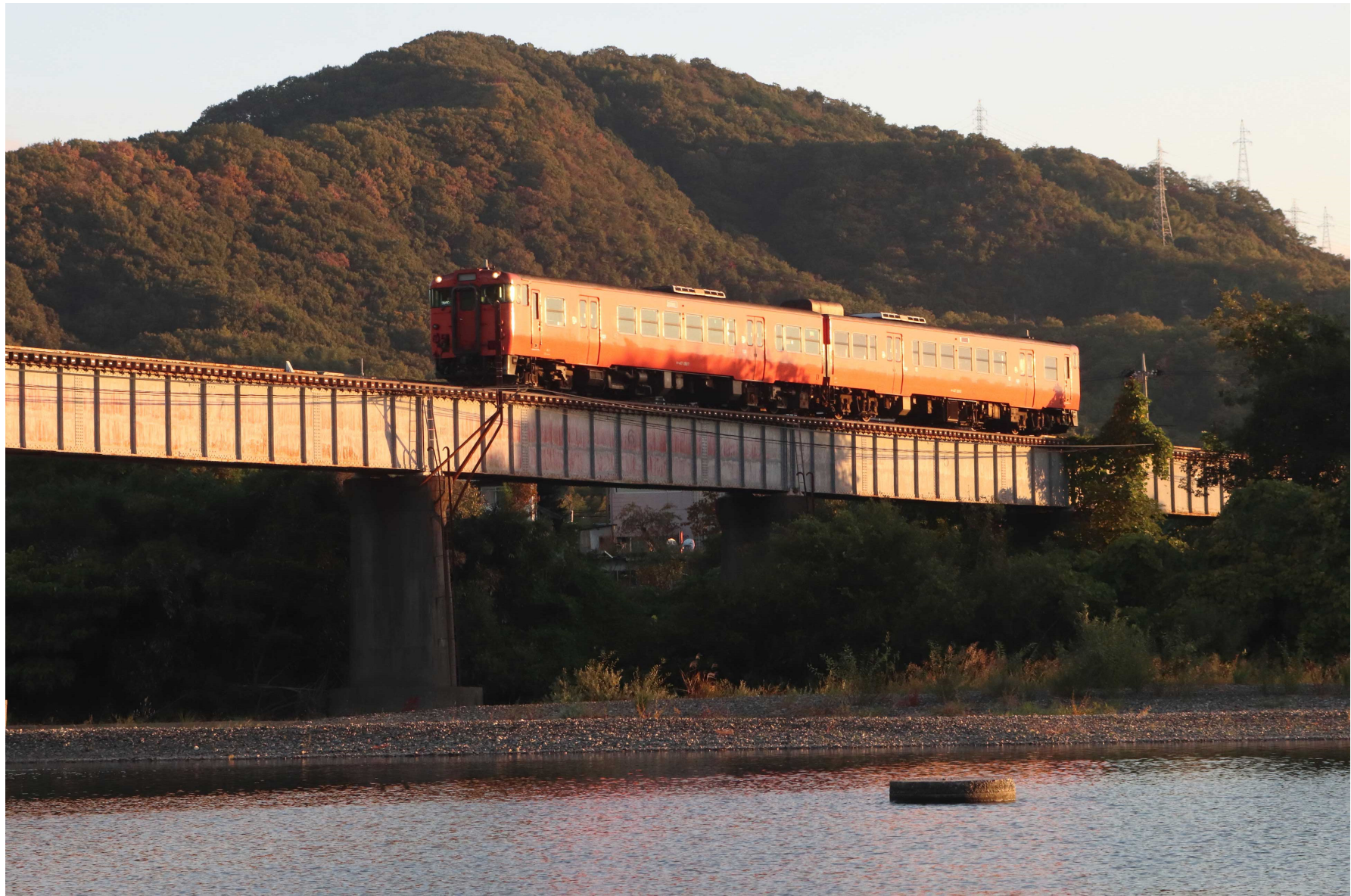
岩徳線西岩国一川西 キハ47形普通列車 2023年10月