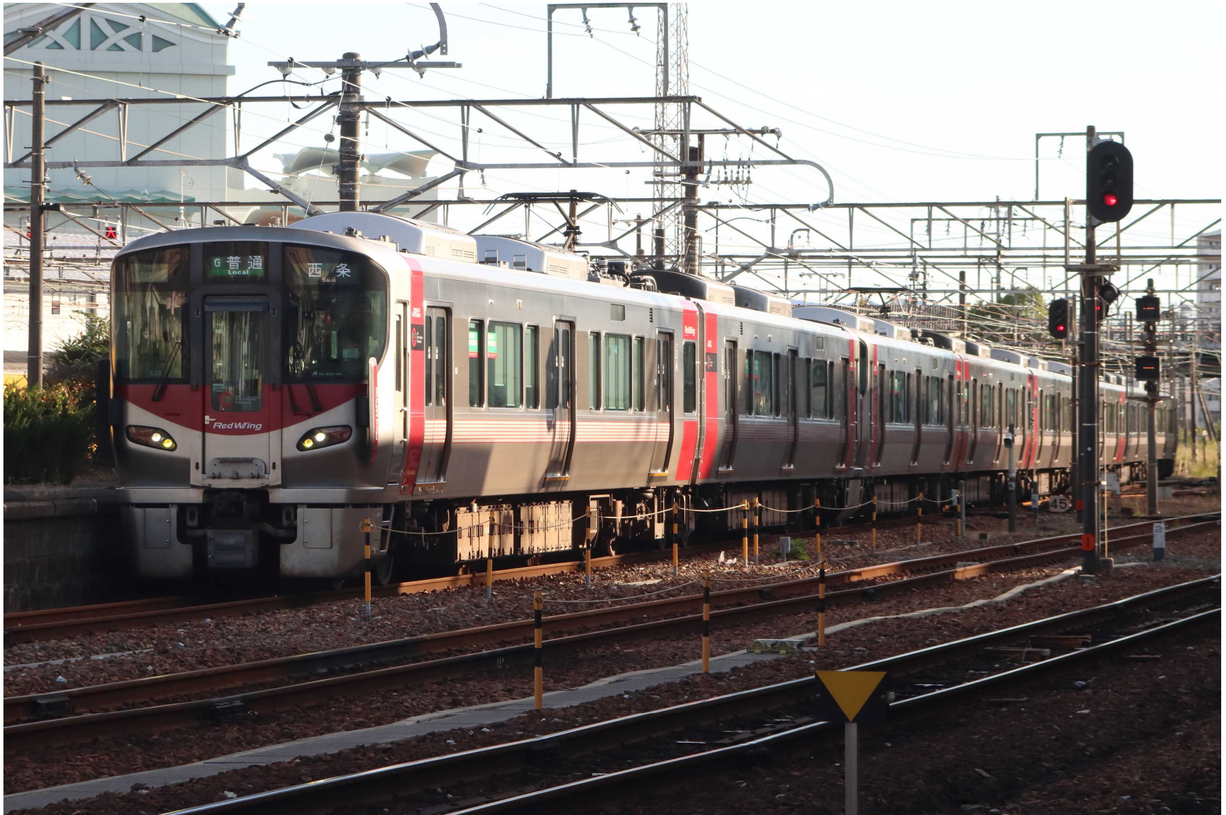
岩国駅（山陽本線） 227系普通列車 2023年10月