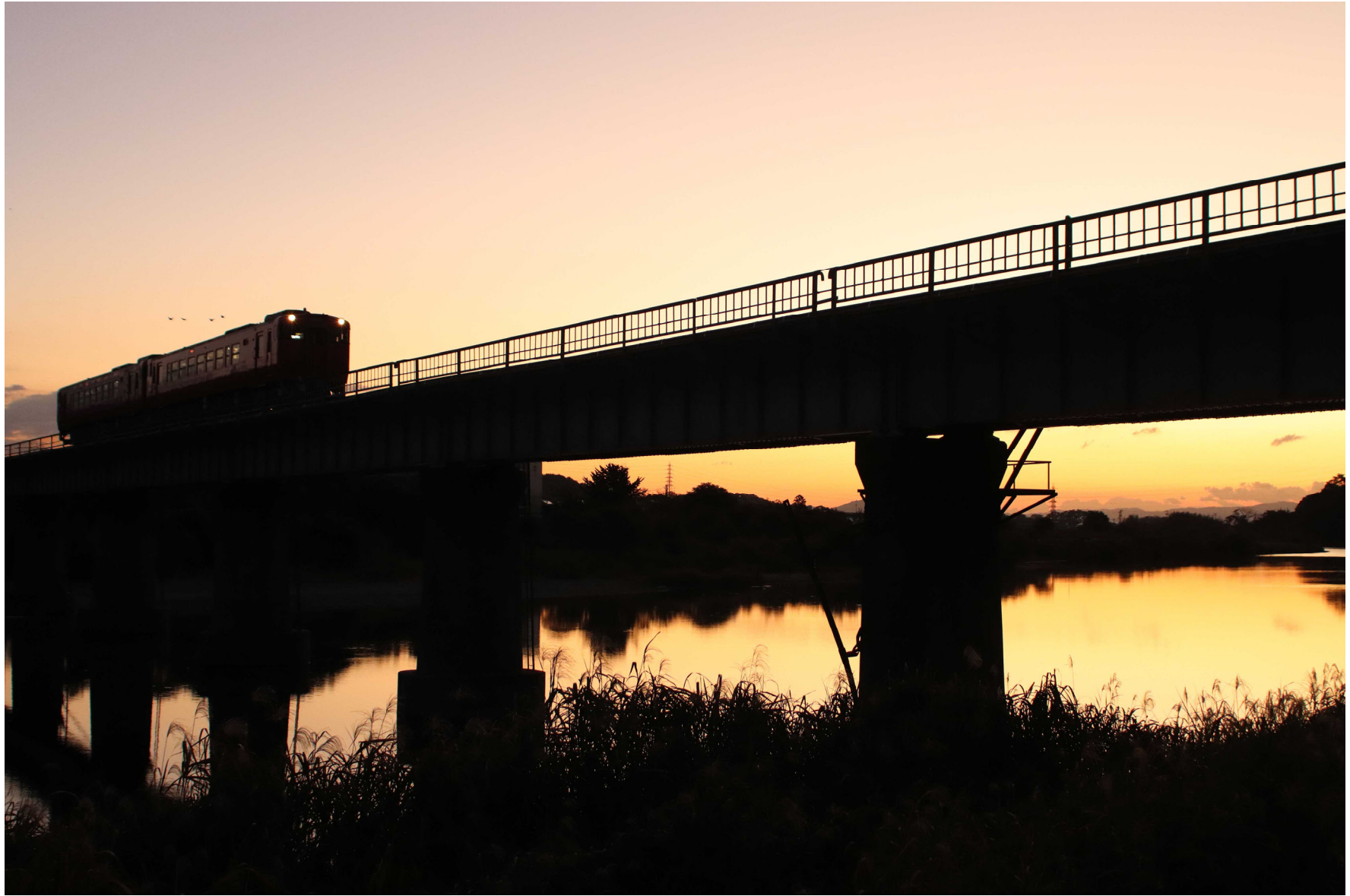
岩徳線西岩国一川西 キハ47形普通列車 2023年10月