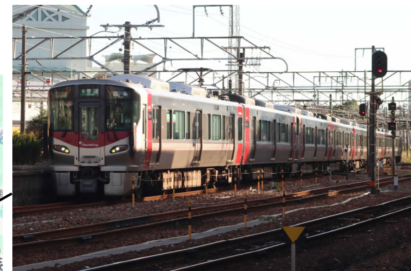
岩国駅（山陽本線）227系普通