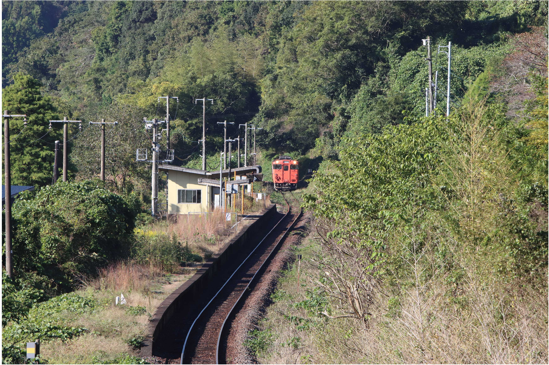
岩徳線高水一米川 キハ40形普通列車 2023年10月