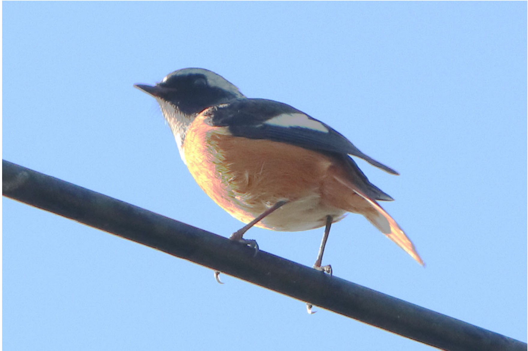
岩徳線米川駅付近 ジョウビタキ 2023年10月