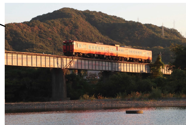
西岩国 - 川西 キハ47形普通列車