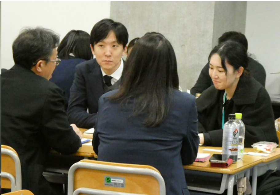
学習成果をポスターセッションで発表